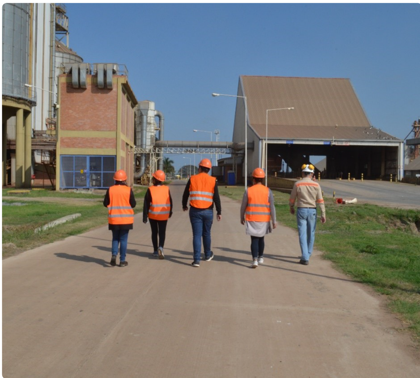
Visita de alumnos a la Planta industrial CAIASA.

desde la recepción de los camiones con las materias primas agrícolas, la descarga, las distintas etapas del procesamiento, que envuelve los procesos físicos y químicos, hasta el embarque en el puerto de los productos industrializados ya listos para exportación.