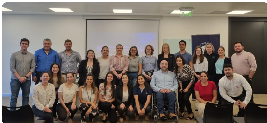
Integrantes de la Mesa de Derechos Humanos y Laborales.