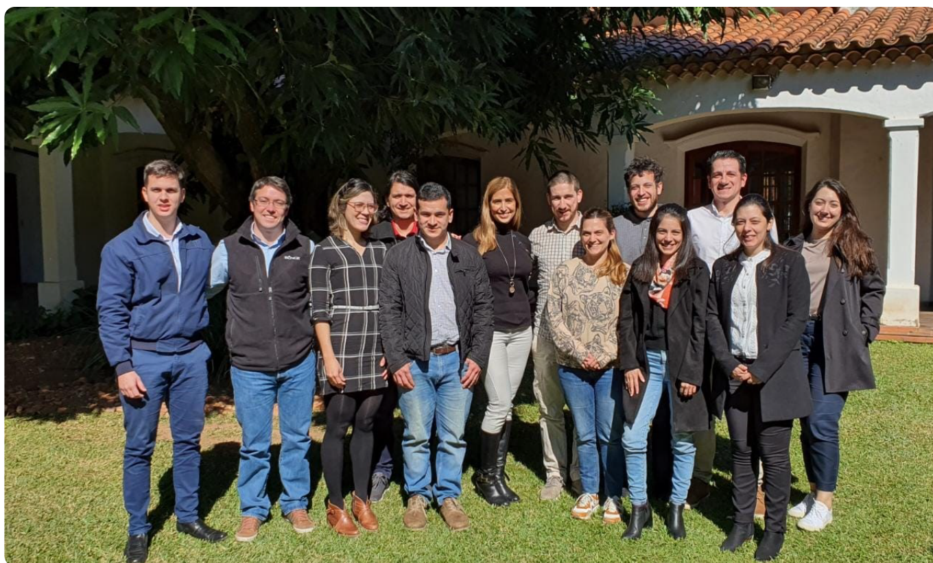
Comisión de Sustentabilidad 2023.

se creó la Comisión de Sustentabilidad, compuesta por especialistas del área de cada una de las empresas asociadas.