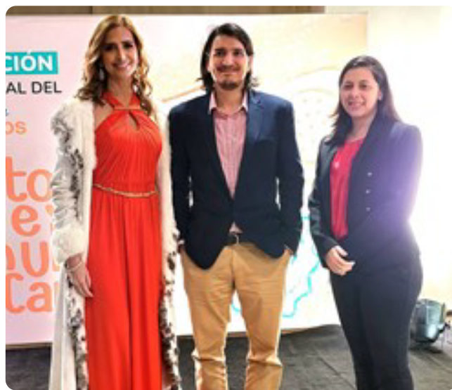
Staff de CAPPRO en la cena del Banco de Alimentos 2023.

Banco de Alimentos, una organización sin fines de lucro. Los bancos de Alimentos son organizaciones que trabajan para aliviar el hambre que padecen miles de personas en el mundo, tienen el objetivo principal de evitar el desperdicio y cuidar el medio ambiente.