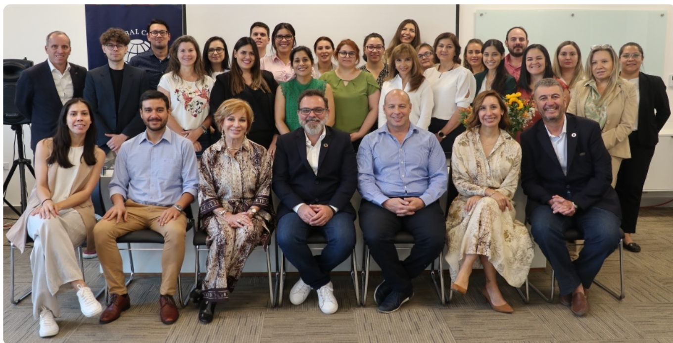
CAPPRO presente en la XVII Cátedra del Pacto Global de las Naciones Unidas – Gestión del Desarrollo Sostenible.

social empresarial a la sostenibilidad corporativa, ¿cómo se diseña una estrategia de sostenibilidad corporativa?: la matriz de la materialidad, cambio climático y la contribución de las empresas, alinear la estrategia de sostenibilidad a los objetivos de desarrollo sostenible, entre otros.