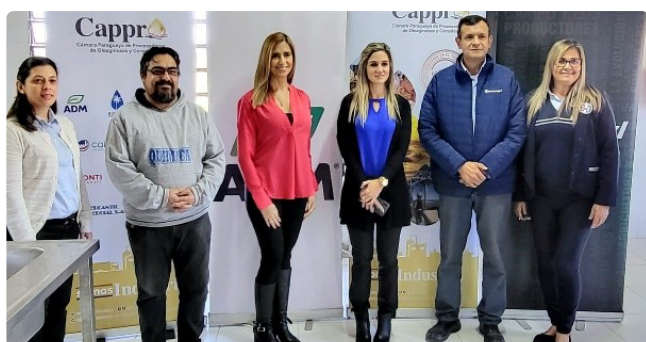
Staff de CAPPRO con directores del colegio entregando Donaciones.

CAPPRO entregó mobiliarios al laboratorio de química industrial del Colegio Dr. Eusebio Ayala de la ciudad de Villeta en el año 2023. CAPPRO está comprometida con la educación de calidad de los jóvenes que en el futuro formarán parte de nuestras industrias. Esta acción corresponde al cumplimiento del ODS 4 (educación de calidad) y ODS 8 (trabajo decente y crecimiento económico).