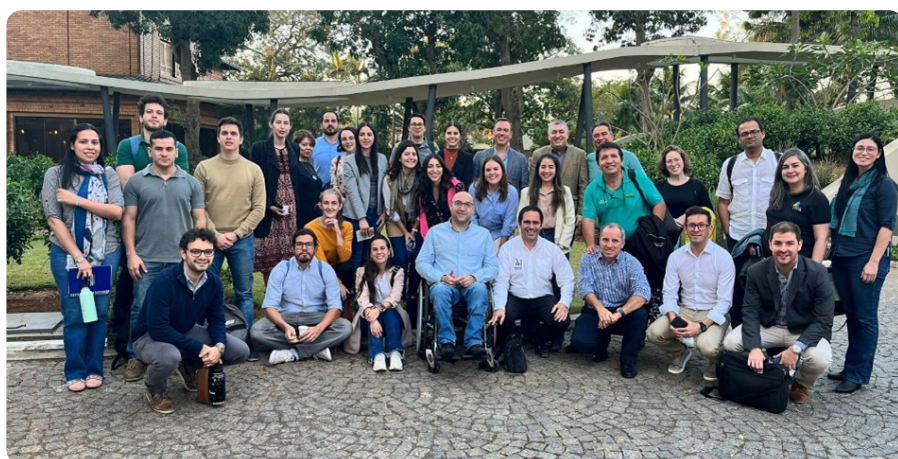
Reunión de la Mesa de Ambiente.