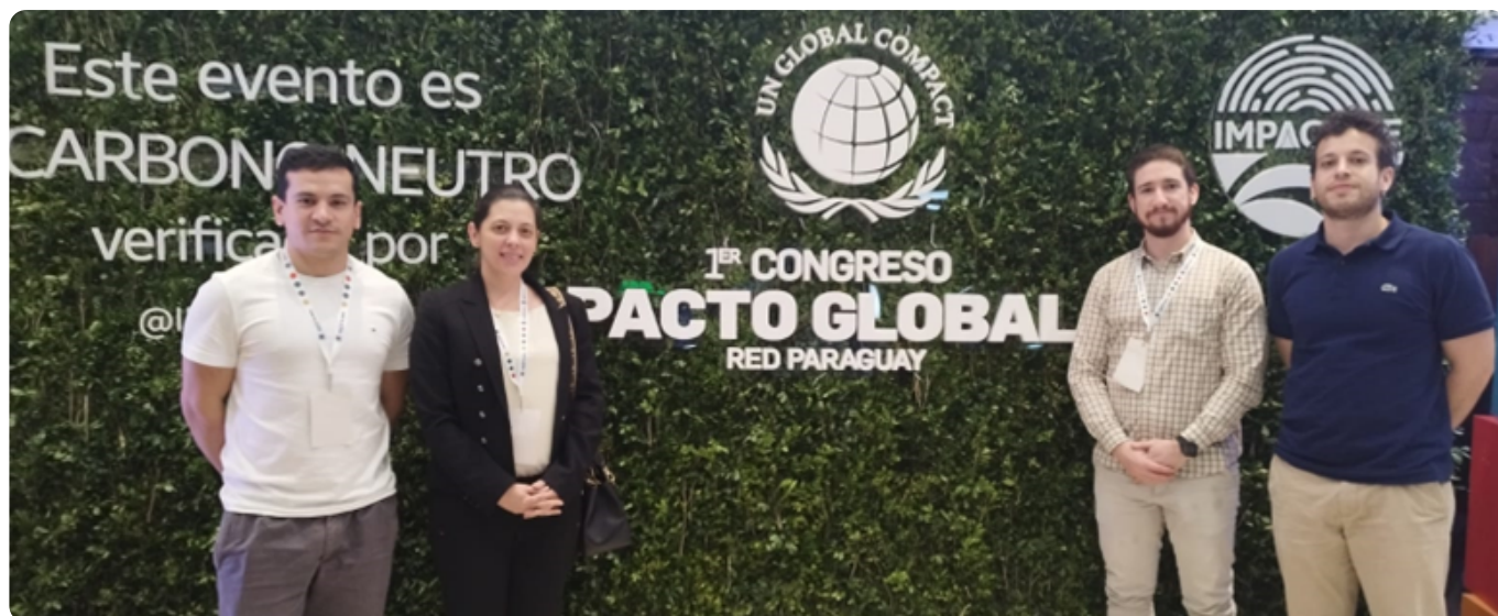
Representantes de la Comisión de Sustentabilidad de la CAPPRO participaron del Primer Congreso del Pacto Global Red Paraguay.

Para este evento fueron invitados speakers nacionales e internacionales, que se enfocaron en brindar conocimientos sobre cómo integrar la sostenibilidad a su estrategia de negocios.