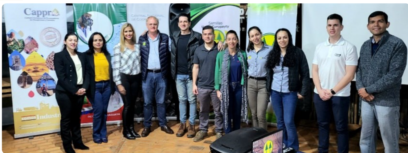
Miembros de la Comisión de Sustentabilidad y el Staff de CAPPRO con Directivos de la Cooperativa.