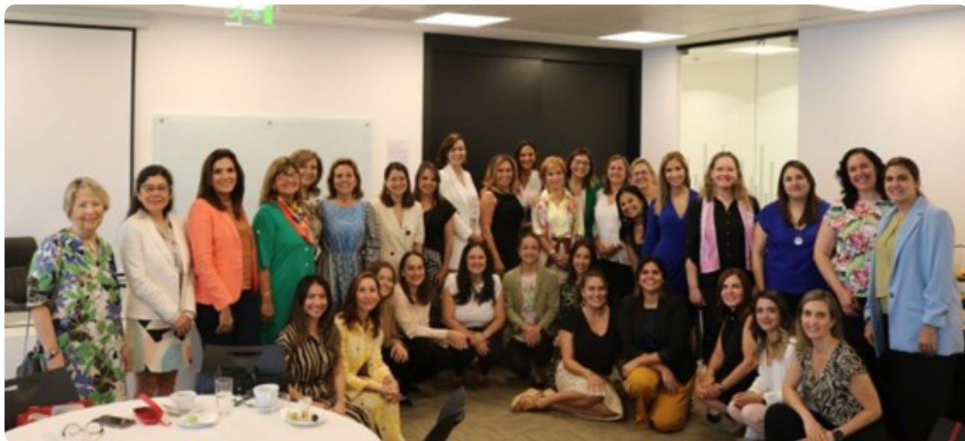
CaFEM por un liderazgo femenino, un desayuno con expertas.