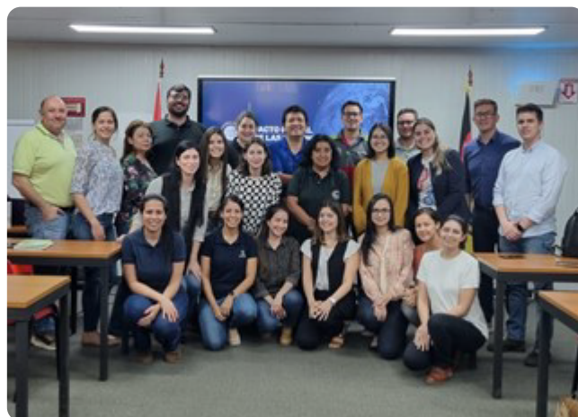
Vista técnica por las instalaciones del Grupo Yaguarete y reunión de la Mesa de Ambiente.

CAPPRO participó de la visita técnica al grupo de empresas de Yaguarete, con el objetivo de analizar como aplican la economía circular en sus procesos. El recorrido comenzó con Cartones Yaguareté, seguidamente Yaguarete Reciclaje (acopio de materia prima), luego a Kartotec (producción de nuevos cartones) y finalmente se volvió a Cartones Yaguarete donde se pudo observar como realizan el ensamblaje de nuevas cajas de cartones.