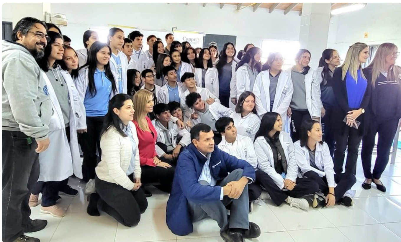
Staff de CAPPRO con docentes y alumnos del colegio Dr. Eusebio Ayala de la ciudad de Villeta.