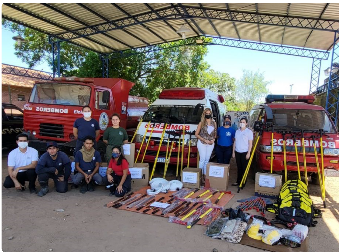
Entrega de donaciones a la Estación de Bomberos de Villeta.

los incendios de forma más segura y efectiva. Algunas de las herramientas entregadas fueron zapatonos, guantes, antiparras, cascos, mochilas CamelBack y machetes. También implementos especializados para la lucha contra incendios forestales como: rastrillos Mc Leod, rastrillos forestales, pulaskis, batefuegos, mochilas extintoras de 2 L de capacidad entre otros artículos.