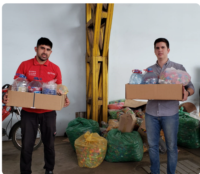
Staff de CAPPRO realizando la entrega de tapitas.

organización de voluntarios que se dedica a recolectar plásticos y con la venta de los mismos ayuda a los albergues de niños con cáncer, y a la vez disminuye el impacto del plástico en el ambiente. CAPPRO apoya esta campaña desde el 2017 y lleva colectado aproximadamente 95 kg de tapitas en este proceso.