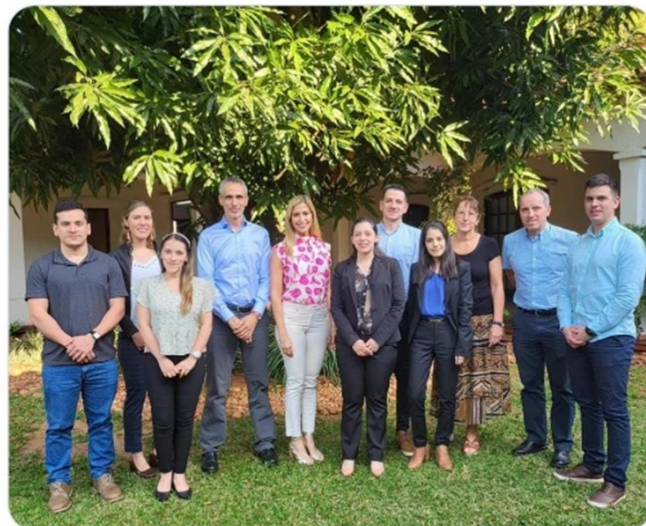
Comisión de Sustentabilidad y Delegación de la UE en Paraguay, agosto 2023

Hoy nos reunimos con @cappropy para dialogar acerca de cómo alcanzar un Paraguay más sostenible. 🌱