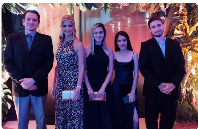
Miembros de la Comisión de Sustentabilidad - Cena 2022

desarrolla e implementa campañas y proyectos ambientales integrales con el fin de crear conciencia, promover buenas prácticas para la producción sustentable y generar estrategias que contribuyan a mitigar los efectos del cambio climático. También implementa proyectos forestales en conjunto con personas, grupos, instituciones educativas y empresas, plantando especies nativas y exóticas en plantaciones puras o en sistemas agroforestales, enriqueciendo bosques degradados y protegiendo bosques amenazados.