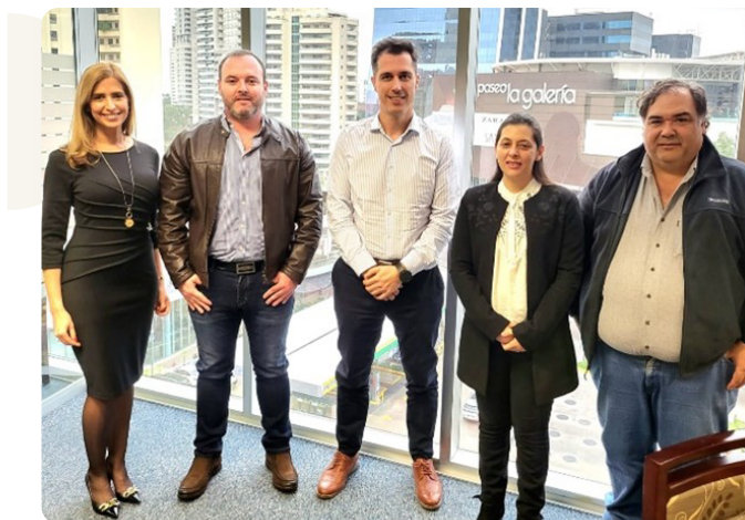
Directores y staff de CAPPRO junto con el Ministro Rolando de Barros Barreto.

La CAPPRO se reunió con el nuevo Ministro del MADES Rolando de Barros Barreto para articular acciones en conjunto que fomenten el desarrollo sostenible del país, mediante una industrialización con prácticas amigables al ambiente.