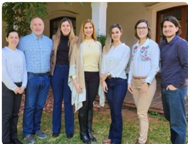
Reunión entre Comisión de Sustentabilidad de CAPPRO y representantes de FOLUR para coordinar acciones.

CAPPRO es un aliado del proyecto, a través del cual se estarán desarrollando proyectos enfocados en la producción sostenible y el cuidado del ambiente.