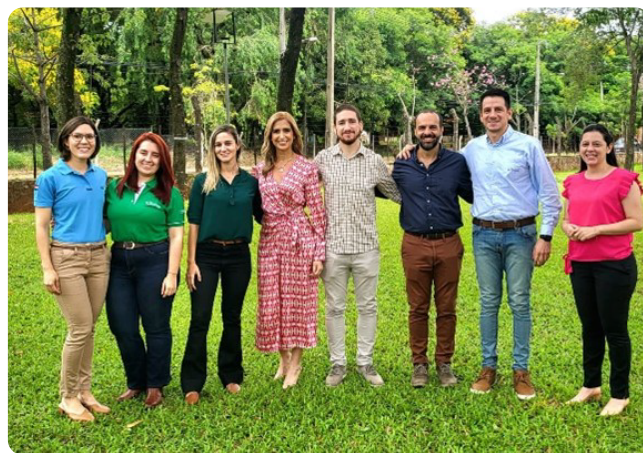
Miembros de la Comisión de Sustentabilidad de CAPPRO que participaron en el primer taller.

Este proyecto cuyo lanzamiento se realizó en el mes de marzo de 2023, está financiado por Land Innovation Fund (LIF) y coordinado por Solidaridad, busca definir un protocolo de Soja Sostenible para el Chaco Paraguayo. Convoca a diferentes actores de la cadena, entre ellos CAPPRO.