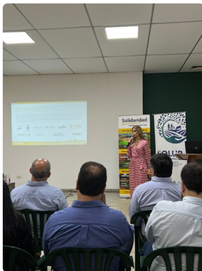
Gerente General de CAPPRO presentando acciones de la Comisión de Sustentabilidad de CAPPRO.