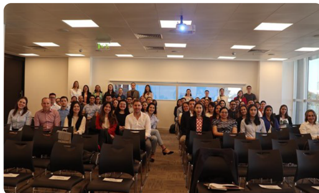
Taller de medición de Huella de Carbono.

CAPPRO participó del taller de medición de huella de carbono que tuvo tres ejes, primeramente se presentaron herramientas corporativas para medición de la huella de carbono, luego se comentaron iniciativas/estudio de casos sobre medición de huella de carbono y sus impactos positivos, por último, se comentaron experiencias en la medición de la huella de carbono.