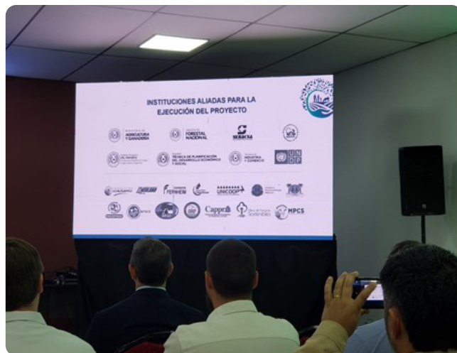
CAPPRO es un aliado para la ejecución del proyecto.