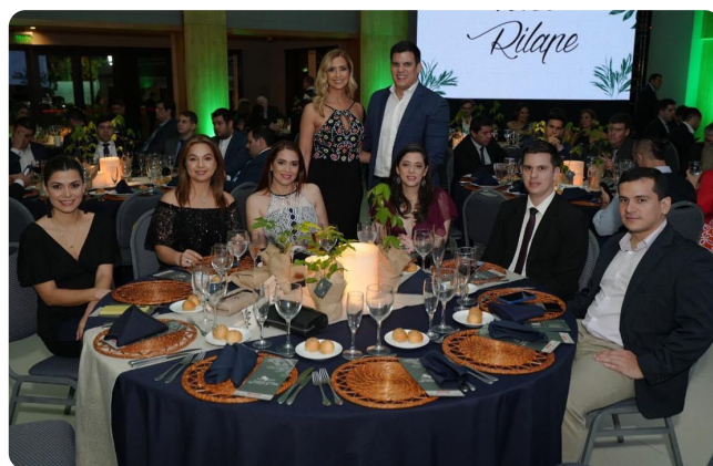
Miembros de la Comisión de Sustentabilidad - Cena 2023