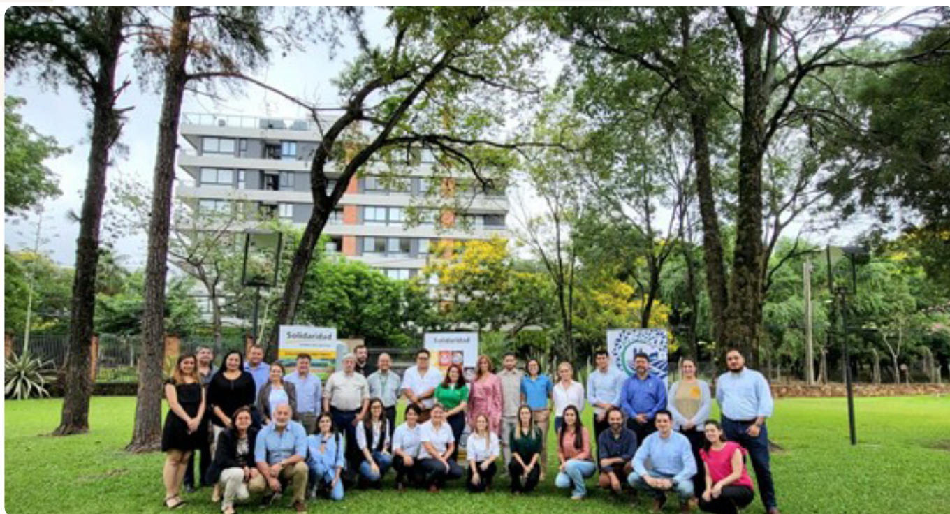
Actores que participaron del primer taller de construcción del protocolo.