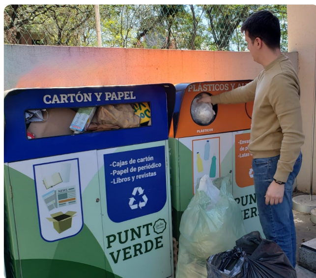
CAPPRO depositó los plásticos separados en los contenedores ubicados en las inmediaciones.