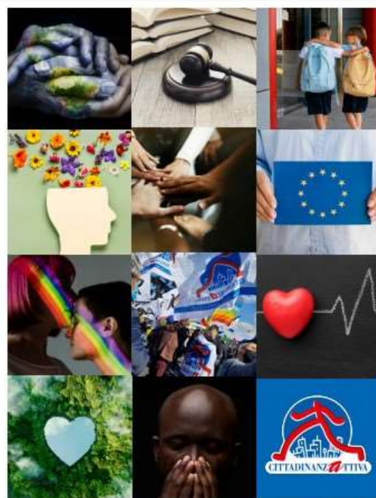
BILANCIO SOCIALE 2022

Al seguente link è possibile trovare tutte le iniziative, le attività e i progetti realizzati da Cittadinanzattiva nel 2021 meglio dettagliati nel nostro Bilancio sociale 2021 e nel 2022 meglio dettagliati nel Bilancio sociale 2022 , pubblicati sul sito web di Cittadinanzattiva.