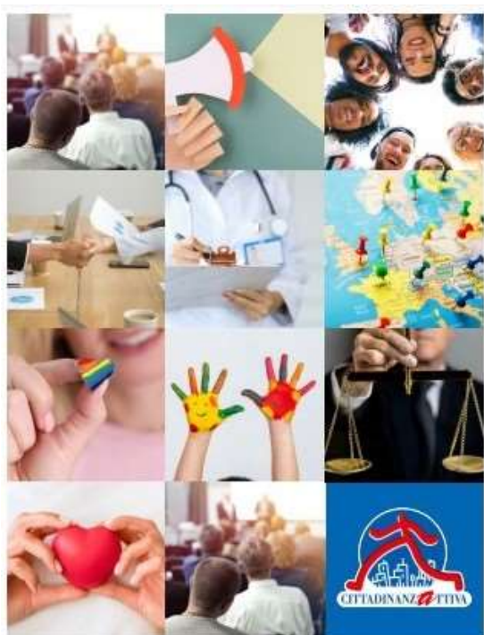
BILANCIO SOCIALE 2021