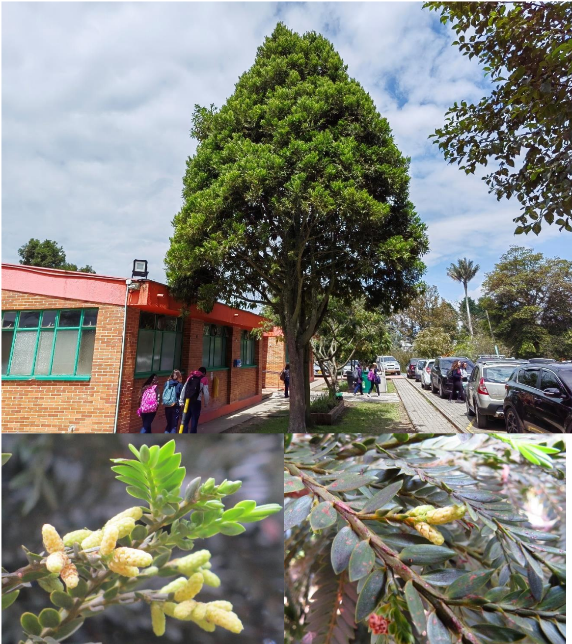
Figura 2. Símbolo ambiental declarado 3 . Pino Romerón 4 Pino Colombiano o Pino Hayuelo ( Retrophyllum rospigliosii )(Pilg.) C.N. Page.

La especie se encuentra en categoría de amenaza VU (Vulnerable; A2acd), según la IUCN 5 . En el campus se encuentran varios ejemplares de esta especie.