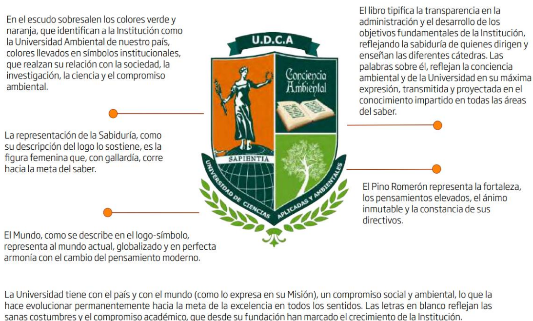
Figura 1. Escudo Institucional U.D.C.A que muestra el compromiso ambiental de la Universidad. 2

Teniendo en cuenta los principios anteriormente descritos, es importante mencionar que la universidad tiene como parte de sus rasgos distintivos y diferenciadores, su compromiso ambiental institucional (Figuras 1, 2 y 3), su compromiso con la Agenda 2030 y con los ODS (ver sección Medio Ambiente; principios 7, 8 y 9). Así mismo, no deja de lado los esfuerzos por promover la educación para la sostenibilidad (EDS) y por aportar en la transición hacia la sostenibilidad ambiental del país y del mundo desde la Educación Superior.