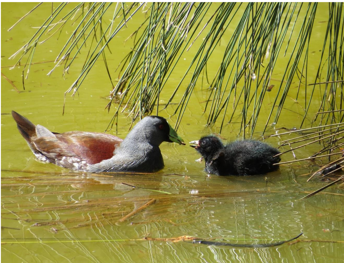
Figura 3. Símbolo ambiental por adopción 3 . Tingüa de Pico Verde 6 , Tingüa Sabanera o Tingüa Moteada ( Porphyriops melanops bogotensis ).

La subespecie se encuentra en categoría de amenaza EN (En Peligro; B2ab(iii, v)); C2a(i) y VU (Vulnerable; B1ab(iii, v)), según el Libro Rojo de Aves de Colombia 7 .