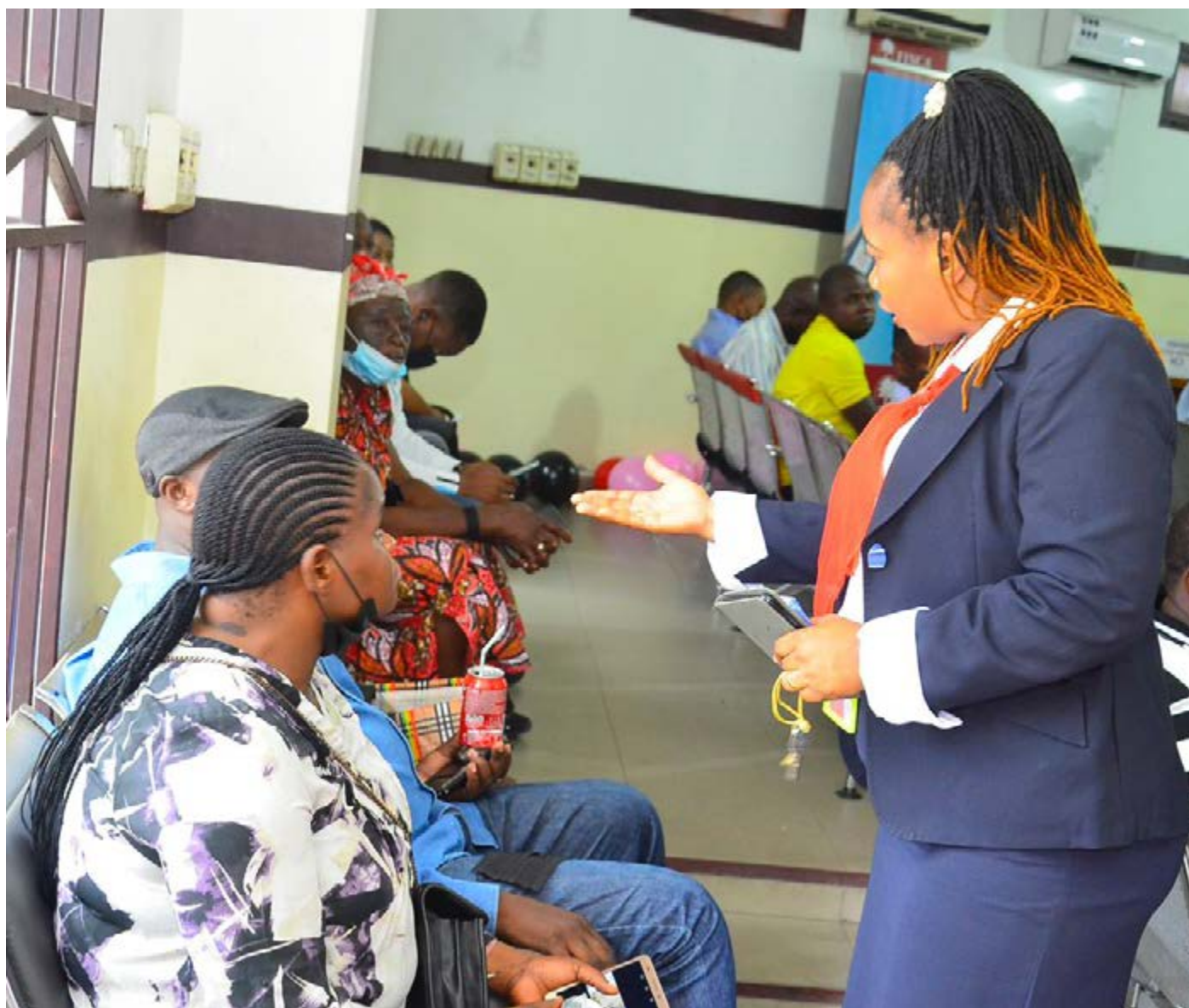
Au service de nos clients - Le client est notre raison d'être.