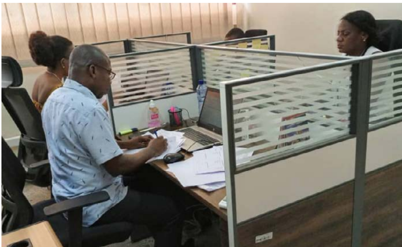
Nouveau bureau des Opérations Bancaires « Reconciliation »