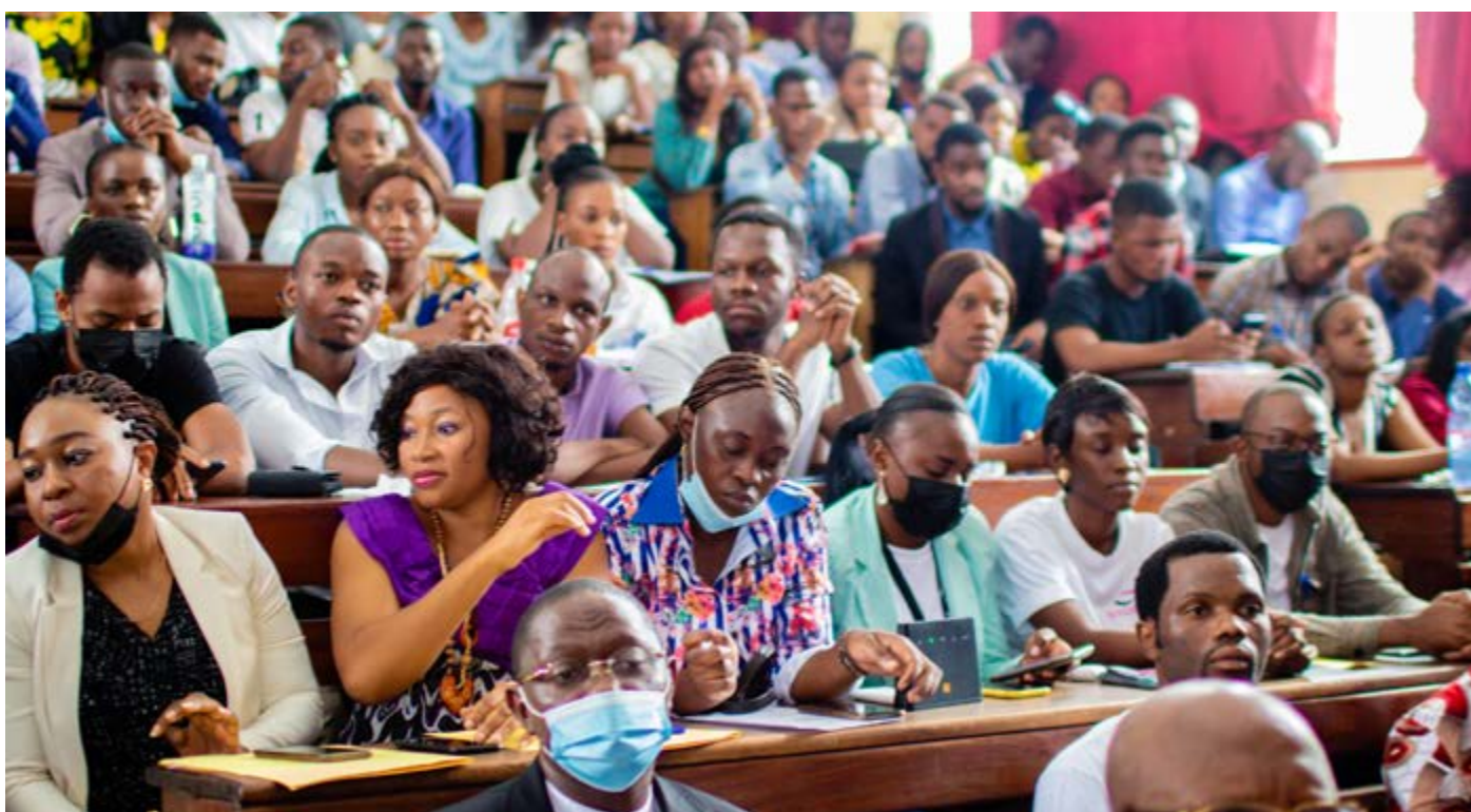
En pleine formation d'Education Financière à l'Université William Booth