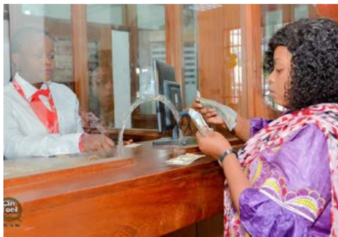
Formée en Crédit