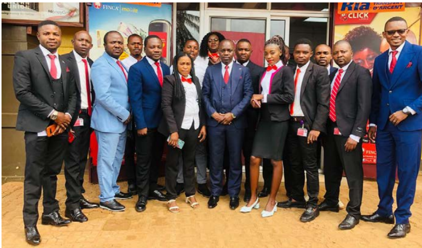
Notre Equipe de FINCA DURBA dans la province du Haut-Uélé

* FINCA participe comme membre de la Commission Anti-Corruption de Global Compact Network, où elle prend part aux différents ateliers et colloques dans les sessions de partage d'expérience.