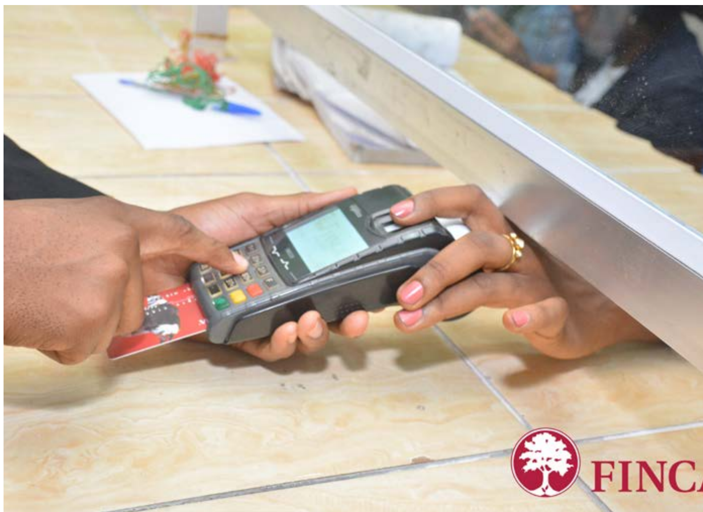
La Transformation Digitale pour répondre au besoin de nos clients