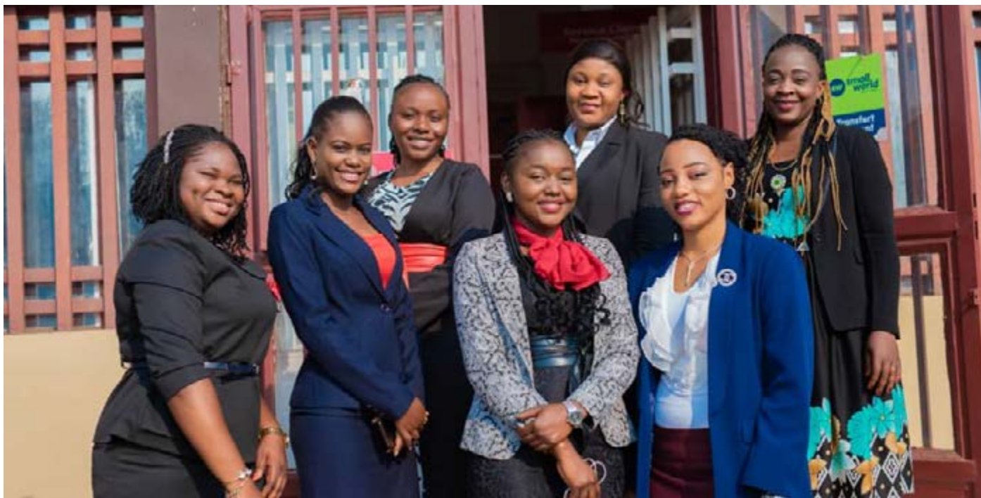
FINCA MBUJI-MAYI - Avec le staff féminin