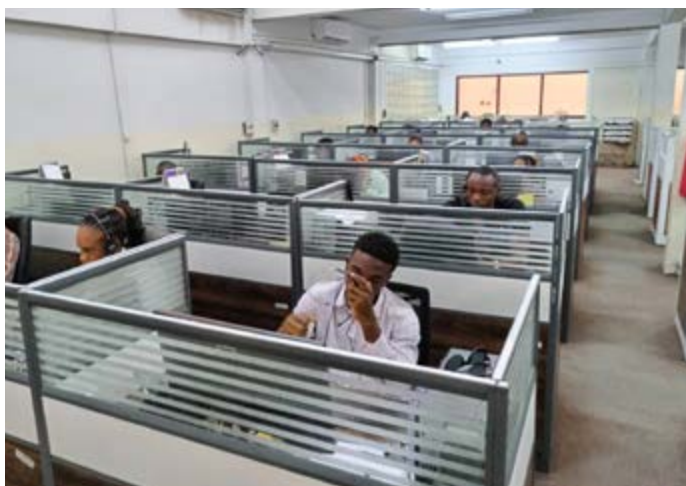
Formation en ligne