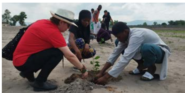
Plantation jumelée d'arbres entre MFC et Jewells