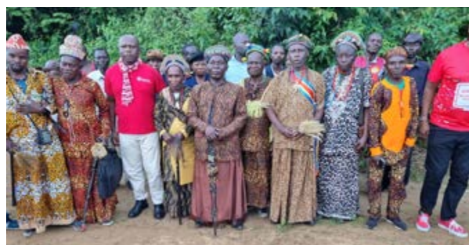
Protection de la forêt à Kalenge dans la province du Kwango