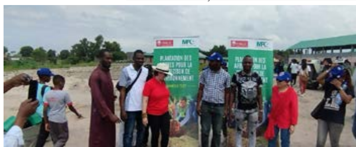
Plantation jumelée d'arbres entre MFC et Jewells