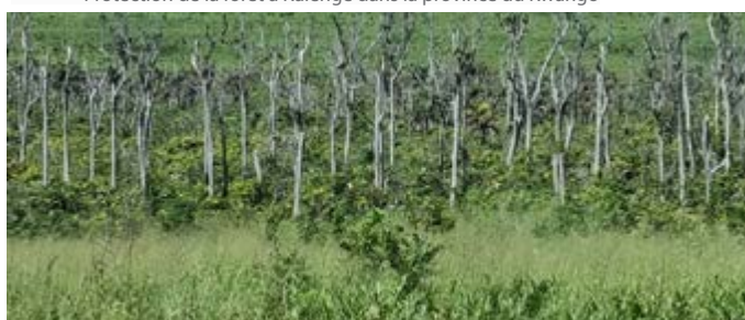
Régénération de la forêt à Kalenge dans la province du Kwango