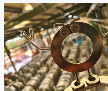
La photo gagnante

Le gagnant a remporté une carte cadeau de 50€ !