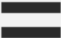
DROITS DE L'HOMME