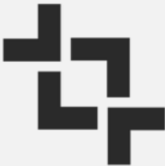
LUTTE CONTRE LA CORRUPTION