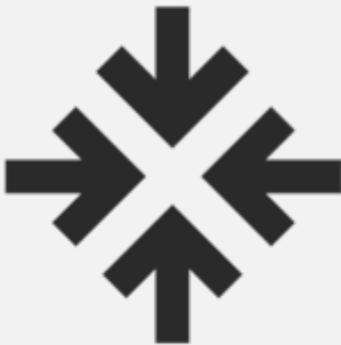
NORMES INTERNATIONALES DU TRAVAIL