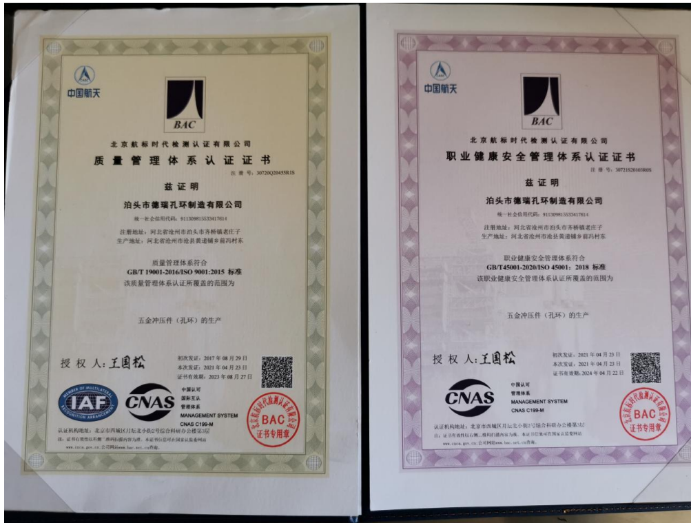
质量管理体系认证和职业健康安全管理体系认证