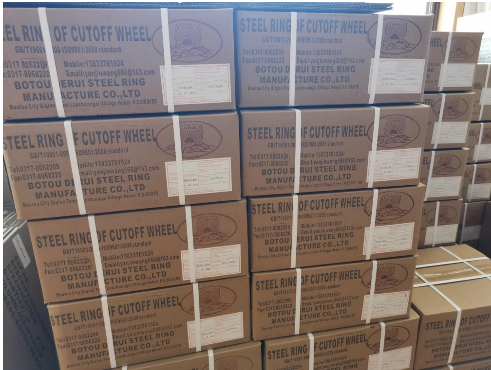
公司主要产品（外包装展示）