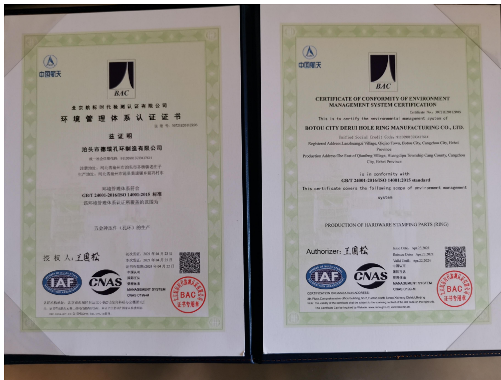
环境管理体系认证证书

德瑞孔环承诺遵守以ISO26000/SA8000社会责任指南及中国本土的法律法规，在坚持合规合法经营的基础上，不忘自身的社会责任，积极以全球的社会责任作为战略目标，一如既往践行社会责任（员工权益、环境和职业健康安全、可持续性采购、商业道德）管理理念；全面履行联合国全球契约十项原则、通过建立规范社会责任管理体系，发展和实施社会责任标准，促进员工的工作条件的改善和增进劳资双方的理解与包容；规范并持续改进社会责任的管理。目前，我司已经通过了ISO 14001和ISO 45001，以及ISO 9001三体系认证。