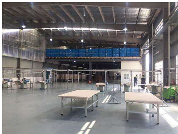
Almacén de Simei en China. N° 2, Pengqing Street, Kunshan, Jiangsu Province, China.