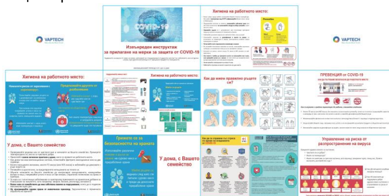
Инструкции за работа и превенция от COVID-19 във всеки работен център