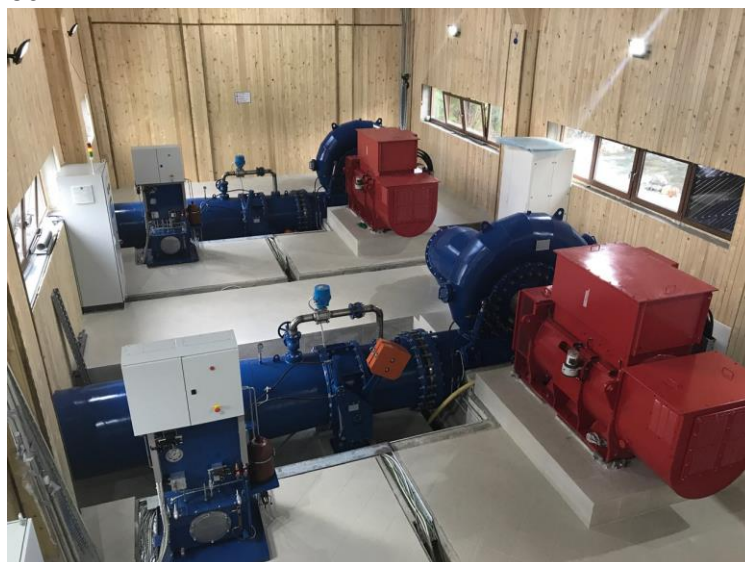
Водноелектрическа централа с ВАПТЕХ технология и оборудване