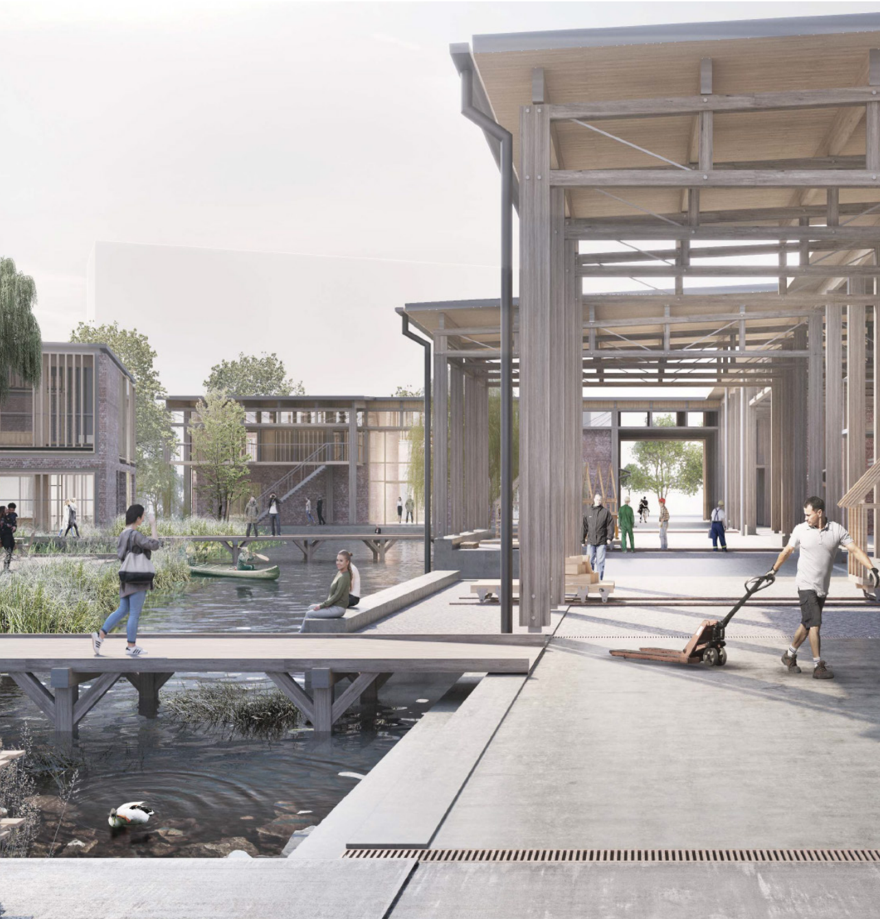
Regnvandsbassinet i midten af byggeriet skal fungere som naturlig afgrænsning mellem kollegieboliger og værksteder og på samme tid fungere som et samlingspunkt for Håndværkskollegiets beboere og brugere.