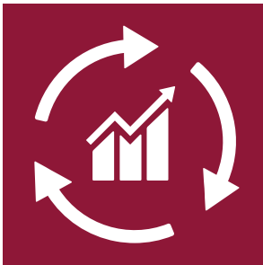
Mål 8 Anstændige jobs og økonomisk vækst

8.4 Frem til 2030 skal den globale ressourceeffektivitet inden for forbrug og produktion løbende forbedres, og det skal bestræbes at afkoble økonomisk vækst fra miljøforringelse, i overensstemmelse med de 10-årige Ramme programmer for bæredygtige forbrugs- og produktionsmønstre, med de udviklede lande i spidsen.