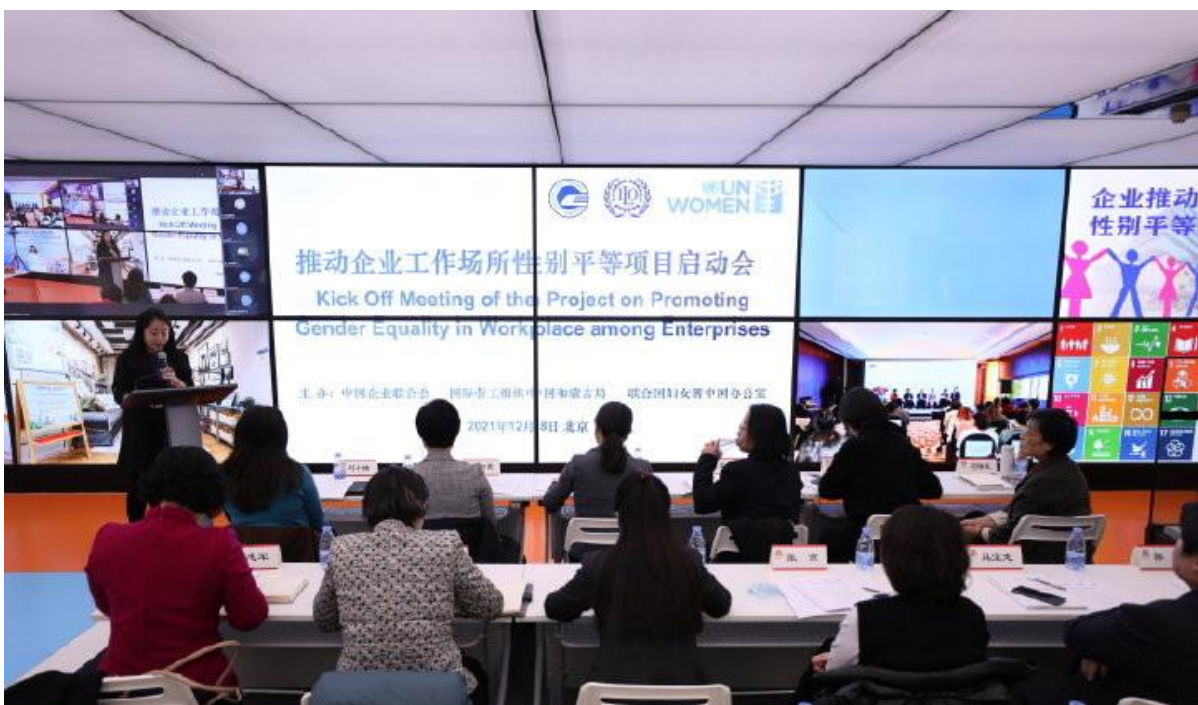
图 5：中国企联与联合国妇女署、国际劳工组织中国和蒙古局共同举办推动企业工作场所性别平等项目启动会