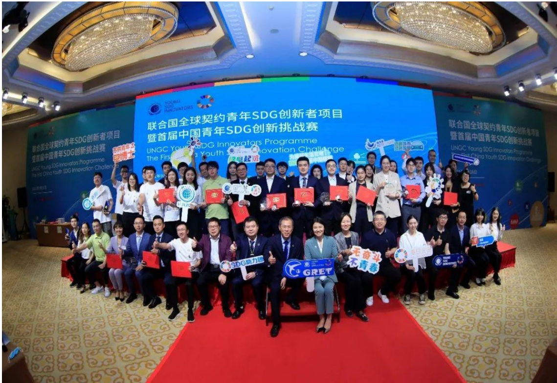
图 2：联合国全球契约青年 SDG 创新者项目（YSIP）闭幕式暨首届中国青年 SDG 创新挑战赛现场

全球契约中国网络联合可持续发展经济导刊共同主办中国区“青年 SDG 创新者”项目，聚焦企业自身面临的可持续机遇和挑战以及与之相关的社会或环境问题，通过一系列围绕可持续发展目标和创新的创新营、专题培训、线上课程、团队合作和实地参访，让学员在导师和专家的协助下，通过模块学习和设计思维，甄别出企业面临的可持续挑战，通过创新设计出更具可持续性的商业模式、产品与服务，创造具有社会和市场价值的切实可行的突破性解决方案，并对解决方案进行测试和验证，助力企业的可持续发展。