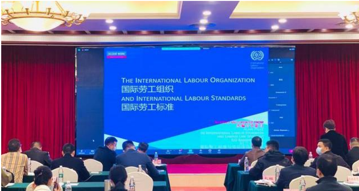
图 4：中国企联与国际劳工组织中国和蒙古局共同举办“一带一路”国际合作与国际劳工标准研讨会