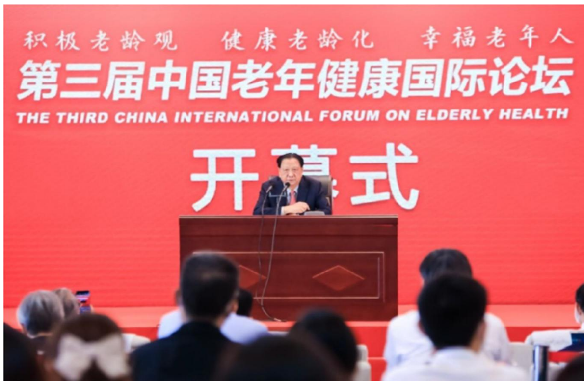
图 3：中国企业联合会、中国企业家协会会长王忠禹出席“第三届中国老年健康国际论坛”

中国企联积极参加国际劳工组织第 108、109 届国际劳工大会，当选国际劳工组织雇主副理事，参加国际劳工组织理事会。中国企联领导出席“第三届中国老年健康国际论坛”、第六届“一带一路”园区建设国际合作峰会等国际合作会议。派代表赴马来西亚参加国际雇主组织百年全球未来工作高峰会议。参与二十国集团工商峰会（B20）就业与教育相关工作。与国际劳工组织中国和蒙古局等共同主办了“一带一路”国际合作与国际劳工标准研讨会，启动推动企业工作场所性别平等项目。与全国总工会、挪威工商总会、挪威总工会联合成功主办中挪四方社会伙伴网络论坛，发布中挪两国雇主和工会组织抗击新冠肺炎疫情进展报告。与挪威工商总会在四川省南充市举办全国企联雇主组织能力提升参与政策制定及调查研究专题培训，强化雇主组织能力建设。编译国际劳工组织《新冠肺炎疫情对各国雇主和企业会员组织的影响及对策的全球调查报告》。