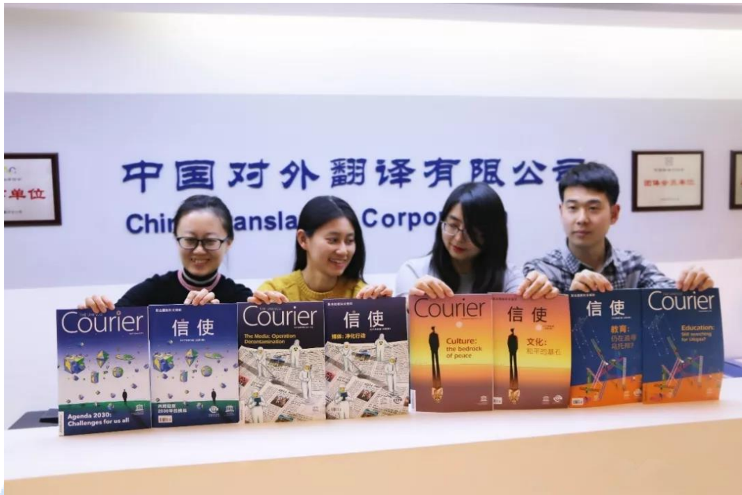
中译公司负责翻译的，复刊后最新的《信使》杂志

2018 年，国际文化发展部在全面梳理整合联合国语言人才培养流程，进一步完善联合国人才培养体制机制的基础上，继续全力推进联合国语言服务培训业务发展壮大。全年共开设联合国文件翻译培训（UNDTT）、联合国口译培训（UNITC）等课程共计 11 期，相比 2017 年同比增长 37%；结合行业动态和新闻热点，邀请联合国高级官员、翻译业界专家及公司内部资深译员，走进校园、面向社会，举办“中译大师汇”等公开讲座和品牌活动共计 16 场；研发并完成相关定制培训项目共 7 个。同时，国际文化发展部负责管理运营公司新媒体矩阵 5 个公众平台，以及公司官方网站中英文版本的改版重建及“中译在线”网站设计建设等工作。