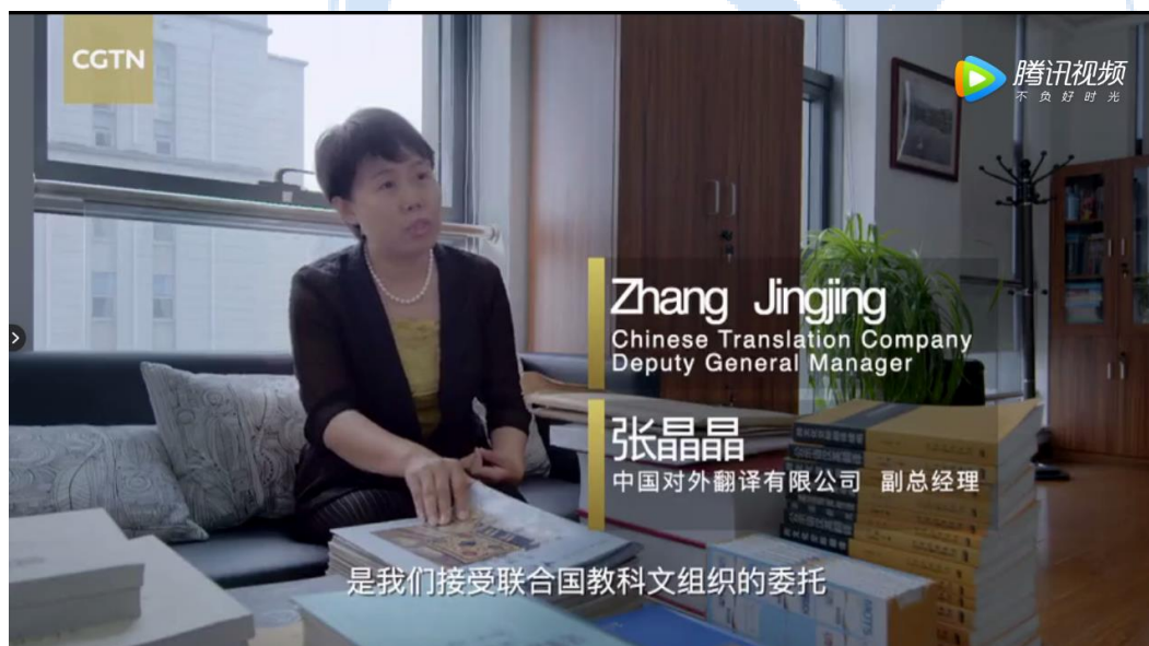
《与世界同行—70 年的中国与世界》大型纪录片在中译公司拍摄画面