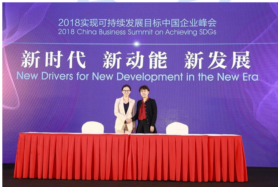
中译公司与全球契约基金会正式签署合作协议并启动仪式揭幕

2018年12月7日，联合国全球契约中国网络“2018实现可持续发展目标中国企业峰会”在北京正式召开，约500家企业代表到场参会。会上，中译公司与全球契约基金会正式签署合作协议，成为其官方合作伙伴，为联合国全球契约组织提供战略性语言服务。