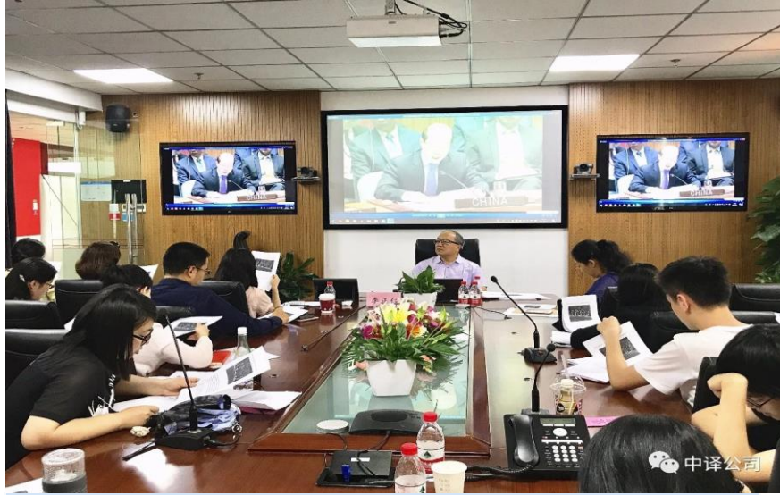
“中译大师讲堂”现场

2018年12月7日，联合国全球契约中国网络“2018实现可持续发展目标中国企业峰会”在北京正式召开，约500家企业代表到场参会。会上，中译公司与全球契约基金会正式签署合作协议，成为其官方合作伙伴，为联合国全球契约组织提供战略性语言服务。