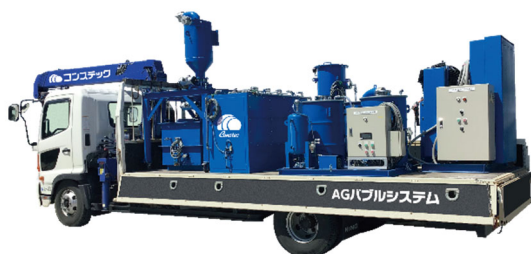
コンステック AG バブルシステム