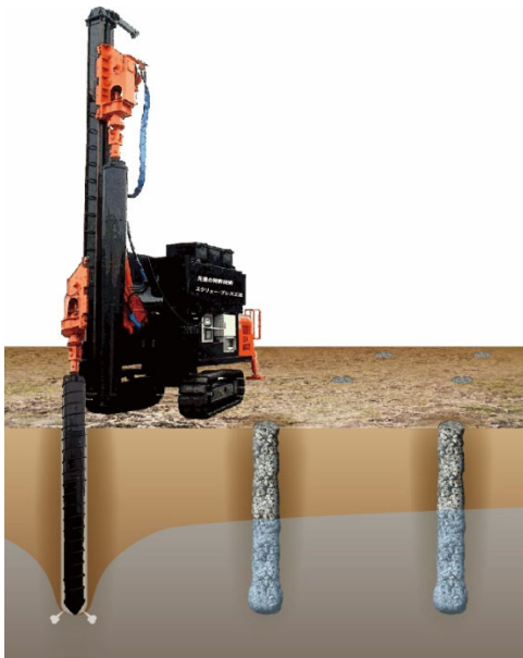
グランテック スクリュー・プレス工法