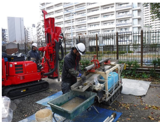
建設環境コンサルティング 土壌汚染調査