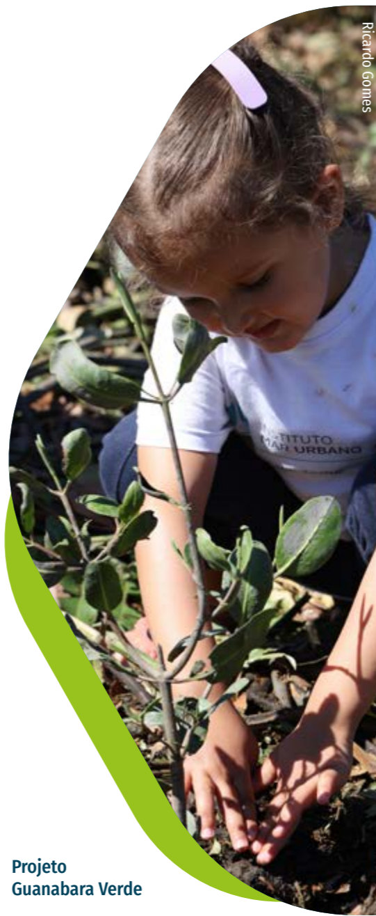
Projeto Guanabara Verde

O projeto Guanabara Verde terá uma duração total de 37 meses e irá promover ações de educação ambiental para a multiplicação de conceitos e boas práticas sobre a cultura oceânica e a conservação de ecossistemas costeiros. Até dezembro de 2021, foram plantadas 10.000 mudas das três espécies de mangue. O detalhamento está apresentado na tabela abaixo: