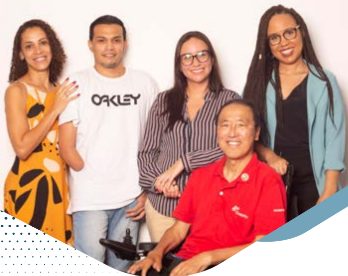
Profissionais PcDs da OceanPact.