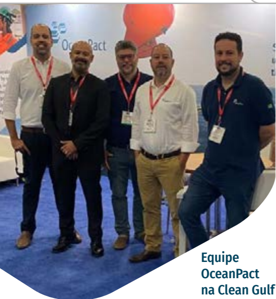
Equipe OceanPact na Clean Gulf