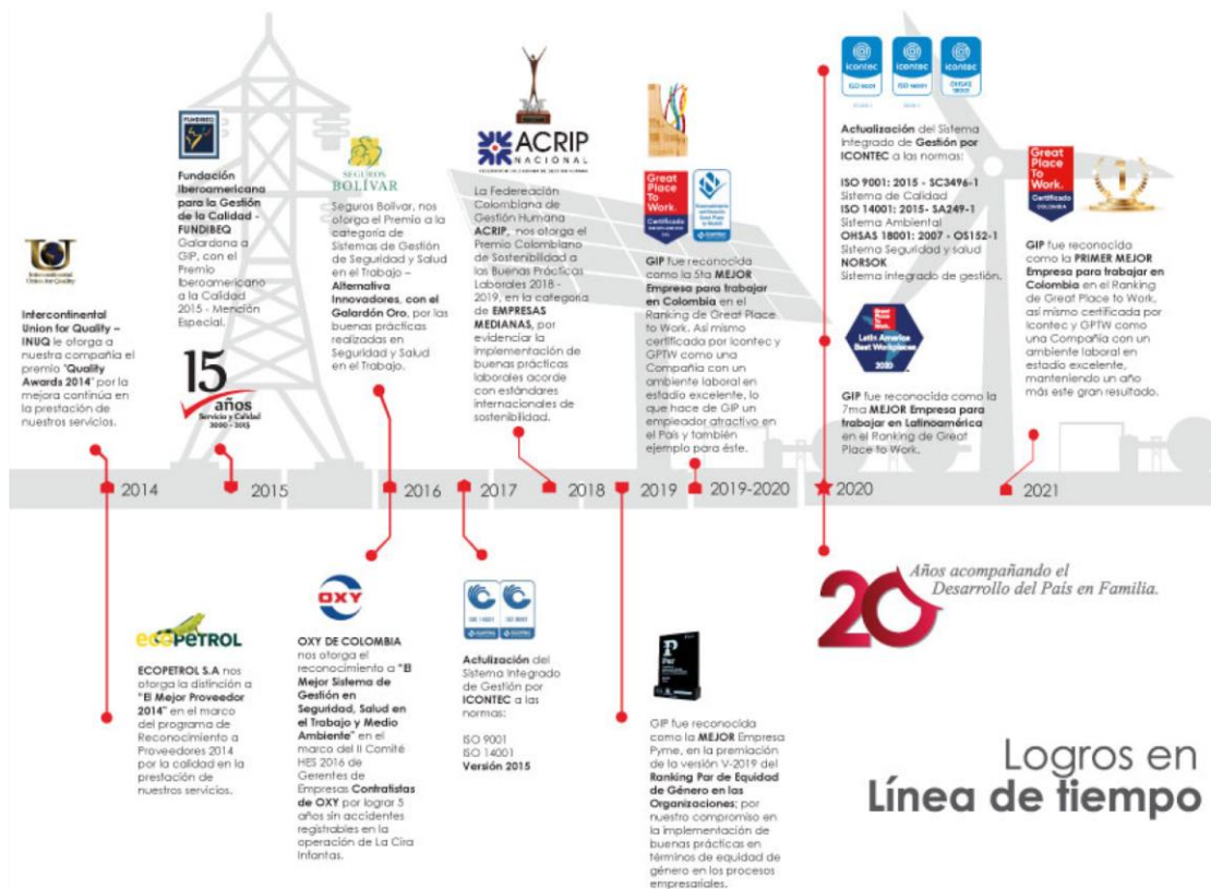
Figura 1: Avance cronológico GIP S.A.S