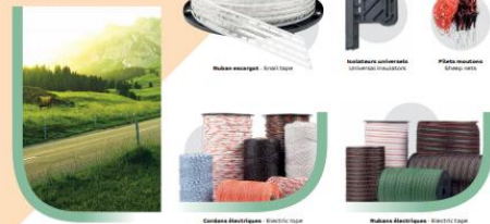
Rubans élastiques - Elastic ribbons Isolateurs universels - Universal insulators Filets insectes - Insect nets

Sangles pour maintenir les filets anti-grêle ou encore clôtures élastiques, nos produits répondent à l'agriculture sous toutes ses exigences extérieures. Anti-hail net bungees and elastic fencing make up our agriculture range, designed to resist to all outdoor conditions and projects.