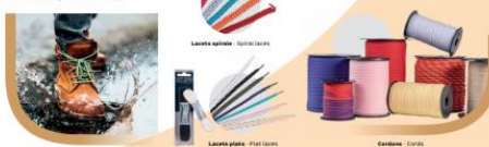
Lacets ronds - Round laces Lacets plats - Flat laces Cordons - Cords

Pour le secteur de la mode, de la rue ou de la maroquinerie, nos sangles, gros grains, rubans, cordons et lacets subissent vos créations. Confectionnées à partir de matières premières de premier choix, nos produits se déclinent sous plusieurs formes et couleurs. For the Fashion, luxury or leather goods sector, our straps, grosgrain, ribbons, cords and laces embrace your creations. Made from top quality raw materials, our products come in several shapes and colours.