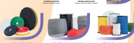
Sangles au mètre - Webbing Cable CPE - Expandable braided cabling Câbles élastiques - Elastic cable

Confectionnées, en bobines / gâchettes ou au mètre, nous fabriquons une gamme complète de sangles, rubans, treillis, élastiques, élastiques et sangles destinés à différents secteurs de l'industrie. Available in rolls, spools or per meter, we manufacture a complete range of webbing, elastic cable, ribbons and brails. For various sectors of industry.