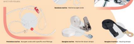
Produits marine - Bungee cords with specific anti-fading Sangles marine - Marine bungee cords Sangles treillis - Webbing at sea

Spécialement étudiées pour résister aux conditions du milieu marin (UV, sel, résistance à l'abrasion), nos produits répondent aux besoins des professionnels et des particuliers. Specially designed to withstand the stresses of the marine environment (UV, salt, abrasion) our products match the needs of professionals and individuals.