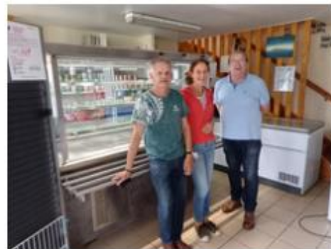
Le mobilier donné par Einea, installé dans les locaux des Restos du Cœur de Eu

Alors qu'une partie du matériel du réfectoire de Eu est aujourd'hui inutilisée, nous avons proposé aux bénévoles des Restos du Cœur de choisir du matériel dans une démarche solidaire mais également pour donner une seconde vie au mobilier. Ils ont donc choisi de récupérer une vitrine réfrigérante, 2 blocs de rangement en inox et une table en inox pour stocker les denrées alimentaires dans leurs locaux.