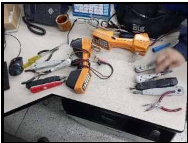
Fotografía dispositivos electrónicos.

Igualmente, las bodegas de almacenamiento principal solo realizan la actividad de almacenaje no tiene implícito alguna actividad de producción o línea de producción. Igualmente se ha venido trabajando con la fundación FUNDAFE, la cual recibe elementos electrónicos que ya so y los transforma en prótesis para discapacitados.