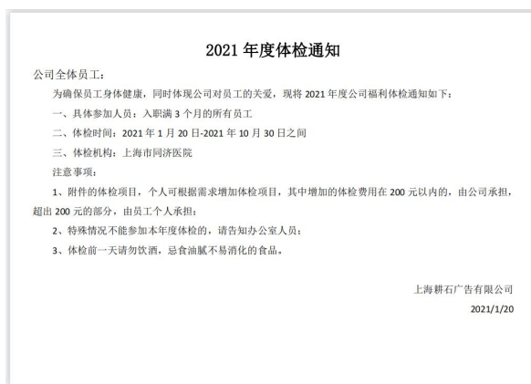
为员工提供年度福利体检