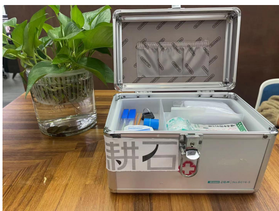
公司配备了急救药箱

在安全管理与职业健康安全方面，我们为员工提供了年度福利体检，公司配备意见箱及药箱。公司每年至少进行了两次消防演习，提升员工逃生自救及灭火技能。