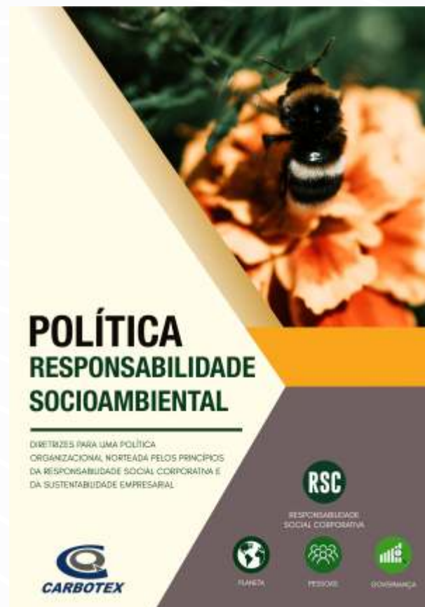
Capas dos documentos disponíveis no site da Carbotex