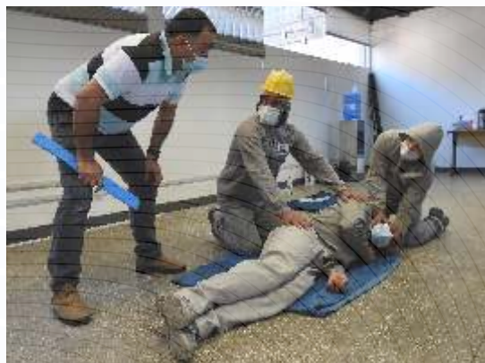
Treinamento - Primeiros Socorros