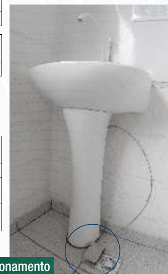
Torneira com acionamento por pedal