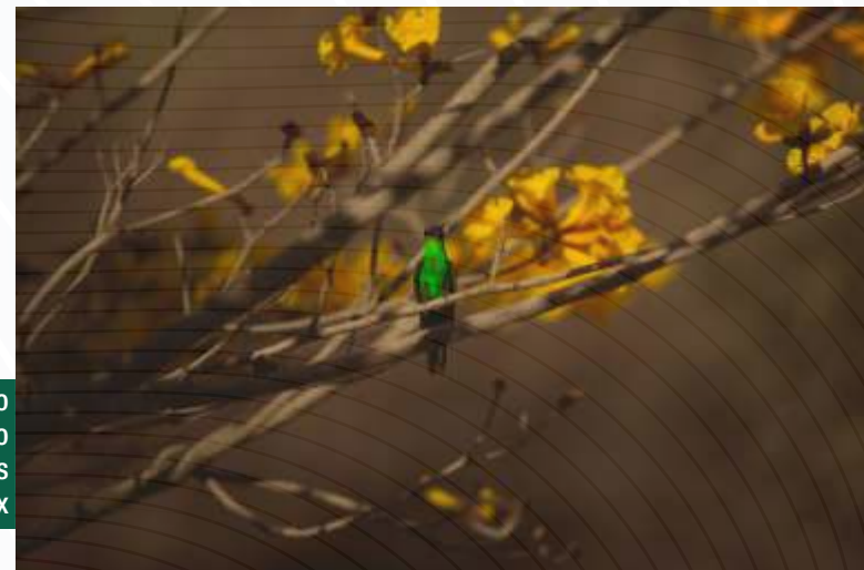
Registro fotográfico feito durante as gravações do vídeo institucional nas instalações da Carbotex

Reconhecendo que existe na propriedade da empresa curso d'água e possíveis nascentes, é dever de todos os funcionários da Carbotex respeitar as medidas de proteção aos mananciais hídricos, agindo de forma preventiva para que produtos químicos ou resíduos orgânicos, oriundos do processo produtivo ou do sistema de coleta de esgoto sanitário, não venham a contaminar esses recursos, causando impactos ambientais que possam prejudicar o bioma local."