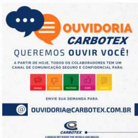
Artes para divulgação