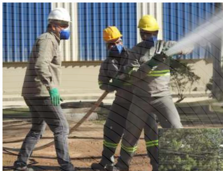
Treinamento - Brigada de Emergência