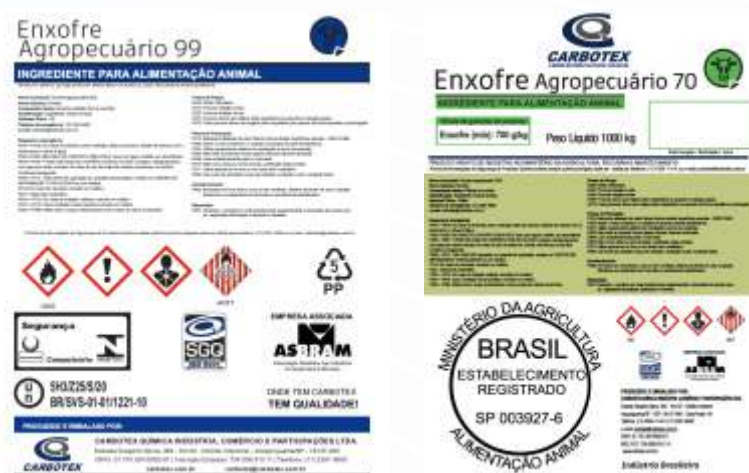
Exemplo de verso de embalagem e etiqueta que acompanha o bigbag

Os produtos possuem rotulagem de embalagens e Ficha de Informações de Segurança de Produto Químico (FISPQ), contendo todas as informações relacionadas aos perigos, medidas de primeiros socorros, combate a incêndio, manuseio, armazenamento, transporte, exposição e proteção individual, além de informações toxicológicas e ecológicas, tudo visando a correta utilização dos produtos.