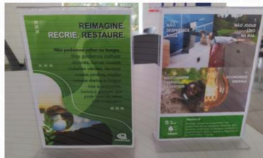
Displays de mesa dispostas nas mesas do refeitório

Não houve no período deste relatório, investigações, processos judiciais, determinações, multas e outros eventos relevantes relacionados ao meio ambiente, porém a empresa possui procedimento de tratamento das principais situações emergenciais envolvendo seus produtos como incêndios, derrames ou vazamentos de produtos químicos.