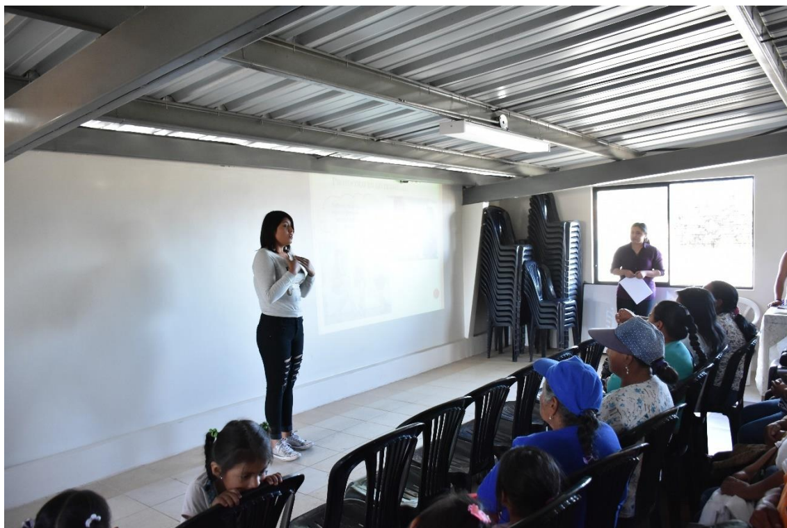
TEMA DEL PROYECTO: Implementación de juegos infantiles en el sector Los Pinos de Santa Rosa parroquia de Tumbaco