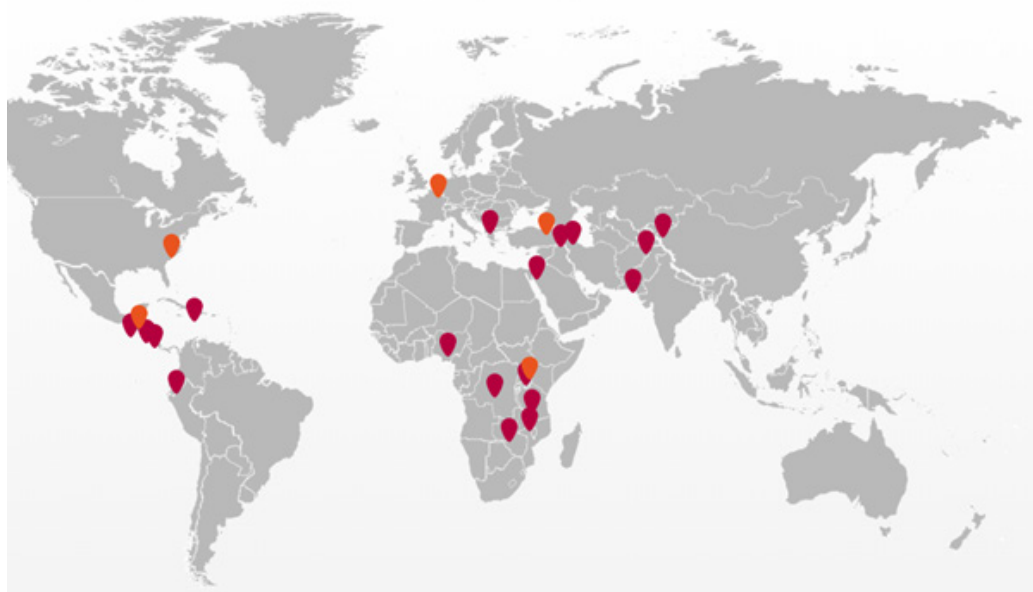
Présence de FINCA dans le monde