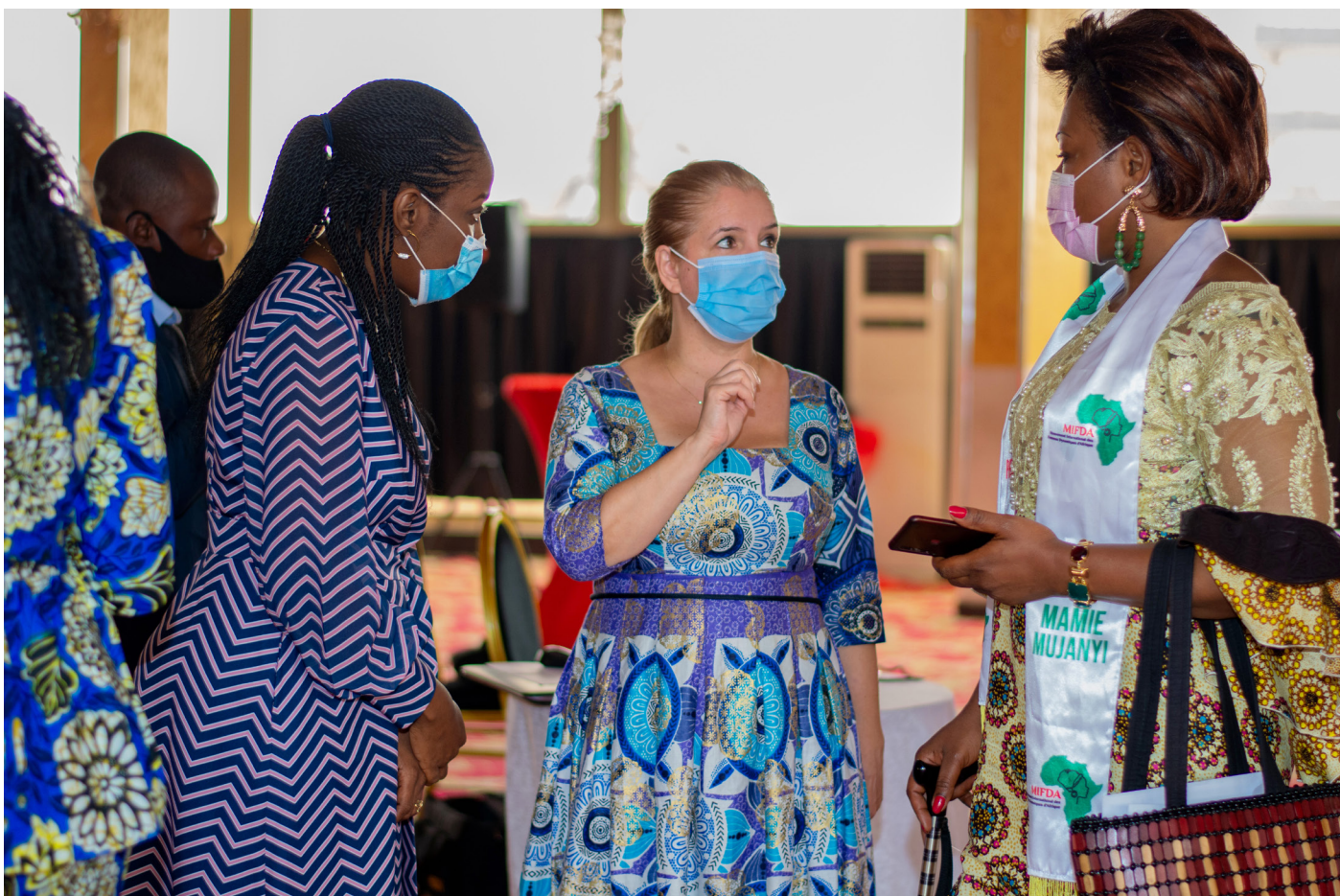
A l'issue de la cérémonie du lancement de JUSTEpourELLE - crédit dédié Femmes