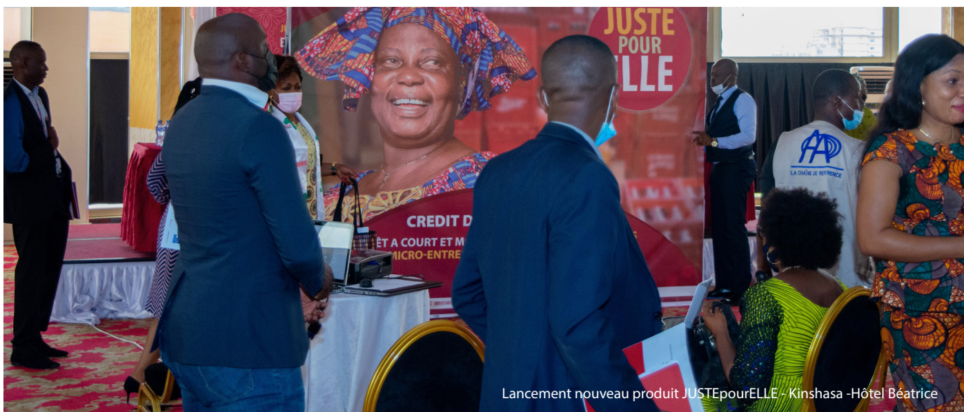
Lancement nouveau produit JUSTEpourELLE - Kinshasa - Hôtel Béatrice