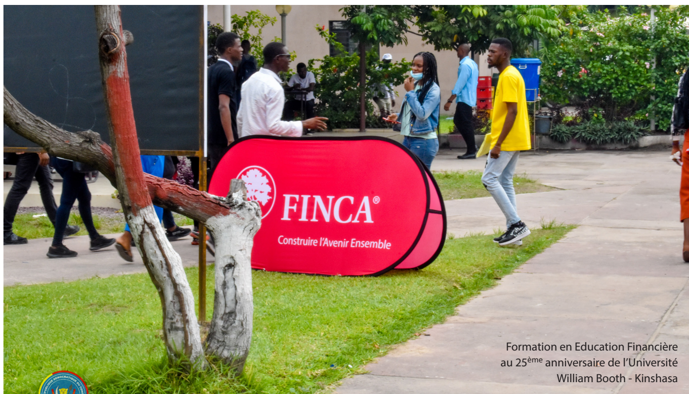
Formation en Education Financière au 25 ème anniversaire de l'Université William Booth - Kinshasa