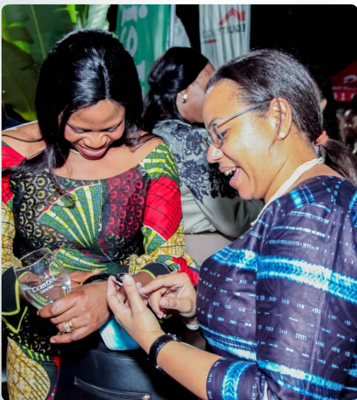
Cocktail des Décideurs au Jardin de la Résidence de l'Ambassadeur de Pays-Bas - 13 Octobre 2021 - Kinshasa