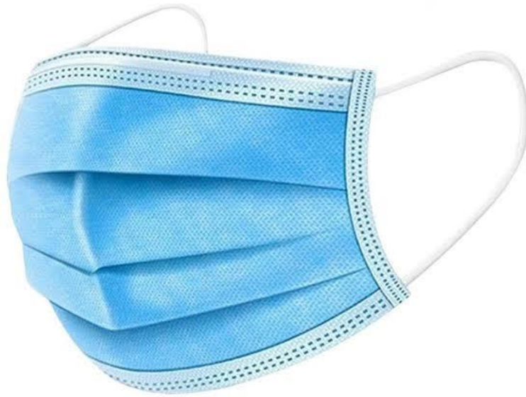
Surgical face mask