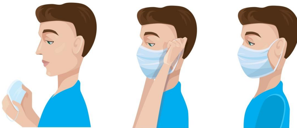
Guiding community people how to wear a face mask