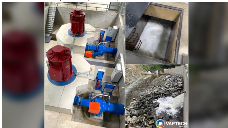
Водноелектрическа централа с ВАПТЕХ технология и оборудване