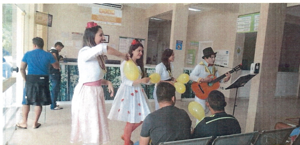
(Palhaços voluntários na unidade)