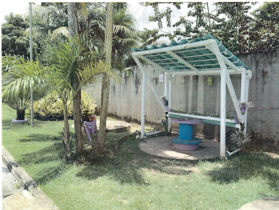
(Projeto de captação de água)

2.9. Captação de Água: Consiste no aproveitamento da água da chuva em um reservatório produzido a partir de tubos plásticos que seriam descartados. Essa água captada é utilizada para regar o jardim do hospital e também lavar as áreas externas. Além de captar água, esta estrutura montada também serve como área de descanso dos colaboradores.