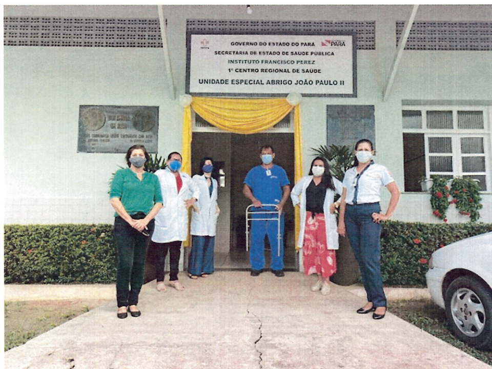
(Ação realizada em abrigos para idosos)