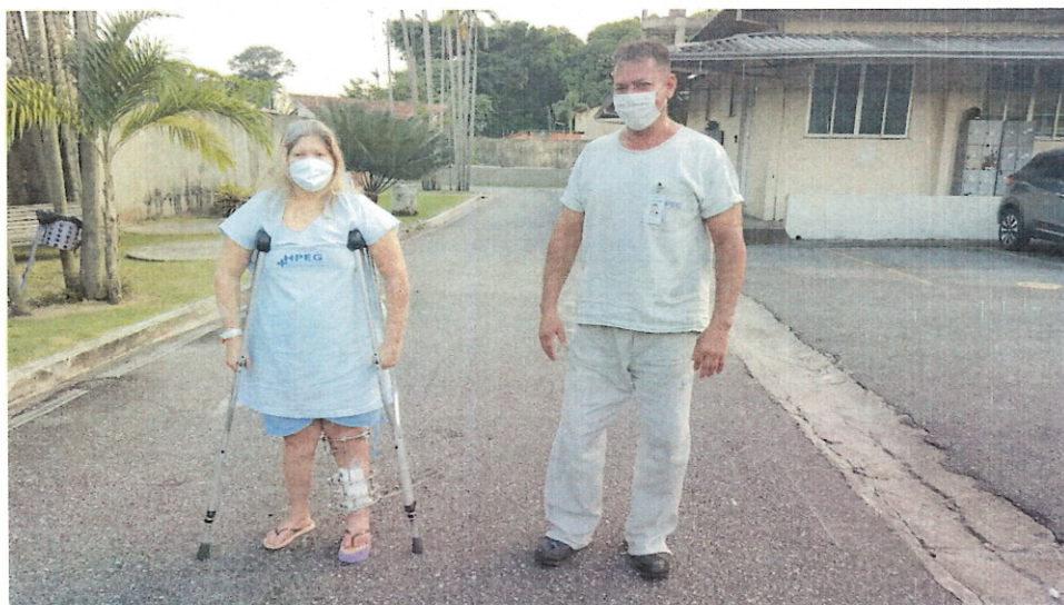
(Paciente utilizando calçado ortopédico confeccionado no HPEG)

2.7. Projeto “Próximo Passo”: Consiste na confecção de calçados ortopédicos, feitos sob medida, após prescrição médica, de forma gratuita, aos pacientes que estão em tratamento de reconstrução e alongamento ósseo.