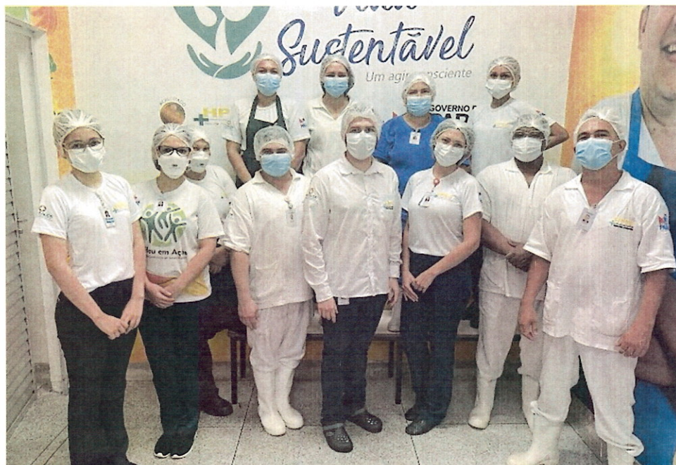
(Renovação Selo Green Kitchen)

2.4. Renovação do Green Kitchen: É um selo verde obtido através avaliação de questões relacionadas a alimentação saudável, sustentabilidade e ambientação natural. Diariamente é oferecido a colaboradores e usuários cardápios equilibrados e saudáveis, priorizando alimentos com valores nutricionais agregados e utilizando produtos industrializados de forma reduzida.