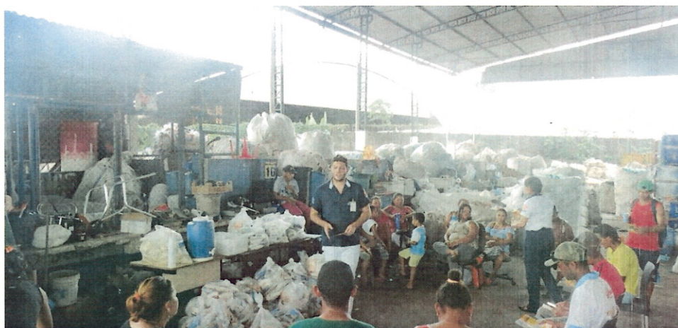
(Campanha de arrecadação de alimentos)