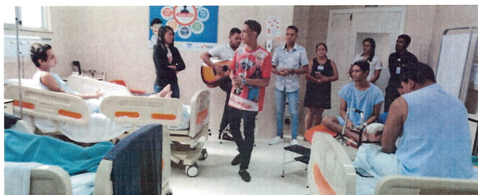
(Voluntários religiosos em ação na unidade)

2.2. Programa de Voluntariados: São voluntários que desenvolvem atividades dentro da unidade, contribuindo para a promoção do bem-estar dos usuários e colaboradores. São atividades de beleza, como corte de cabelo e maquiagem; massoterapia; musicoterapia, palhaçaria artística; e religiosos, para o bem-estar espiritual.