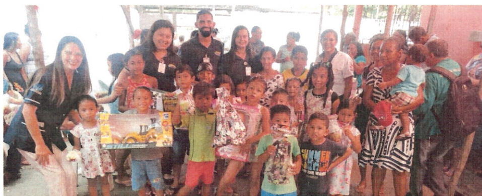
(Entrega de brinquedos em ação de natal)

2.2. Programa de Voluntariados: São voluntários que desenvolvem atividades dentro da unidade, contribuindo para a promoção do bem-estar dos usuários e colaboradores. São atividades de beleza, como corte de cabelo e maquiagem; massoterapia; musicoterapia, palhaçaria artística; e religiosos, para o bem-estar espiritual.