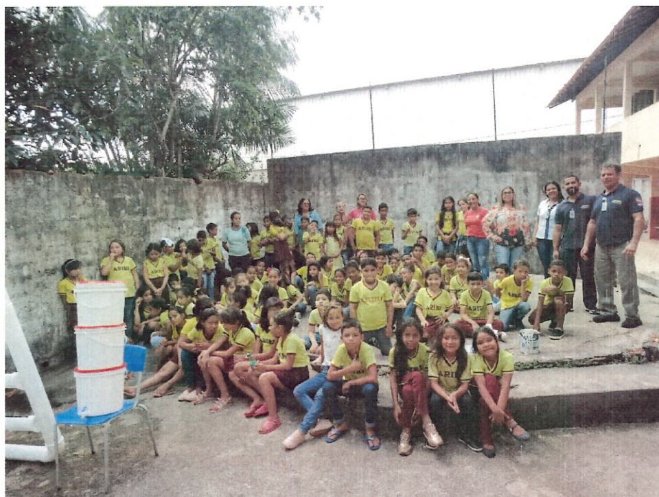
(Confecção de uma horta sustentável em escola estadual)

2.4. Renovação do Green Kitchen: É um selo verde obtido através avaliação de questões relacionadas a alimentação saudável, sustentabilidade e ambientação natural. Diariamente é oferecido a colaboradores e usuários cardápios equilibrados e saudáveis, priorizando alimentos com valores nutricionais agregados e utilizando produtos industrializados de forma reduzida.