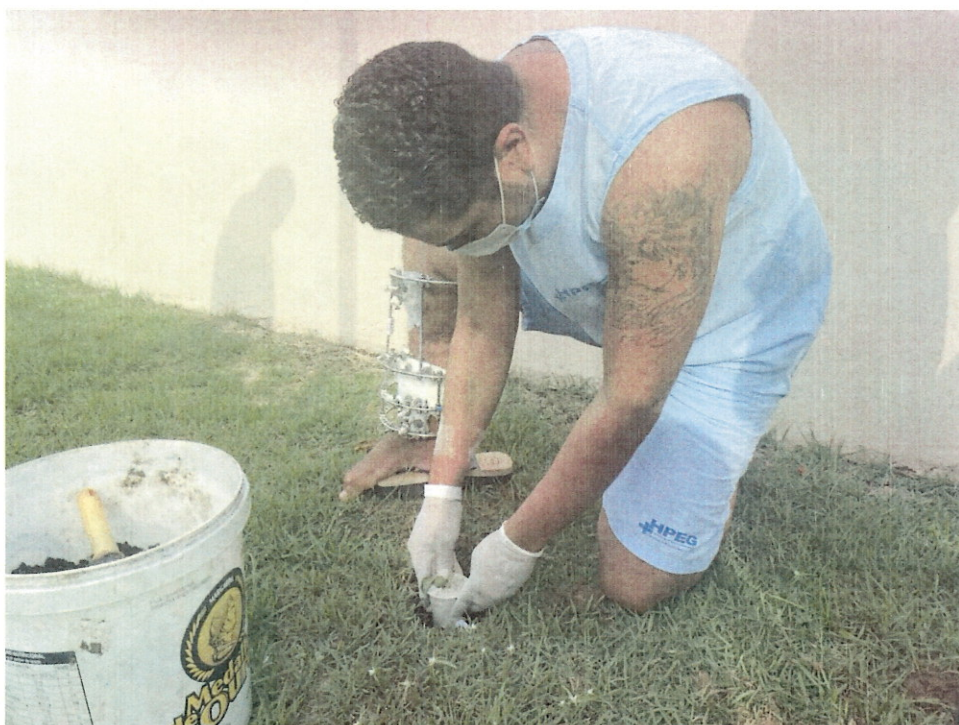
(Plantio de mudas de árvores)

2.11. Ações educativas para pacientes internados: Plantio de árvores, reforçando a importância com a preservação e cuidado com o meio-ambiente.