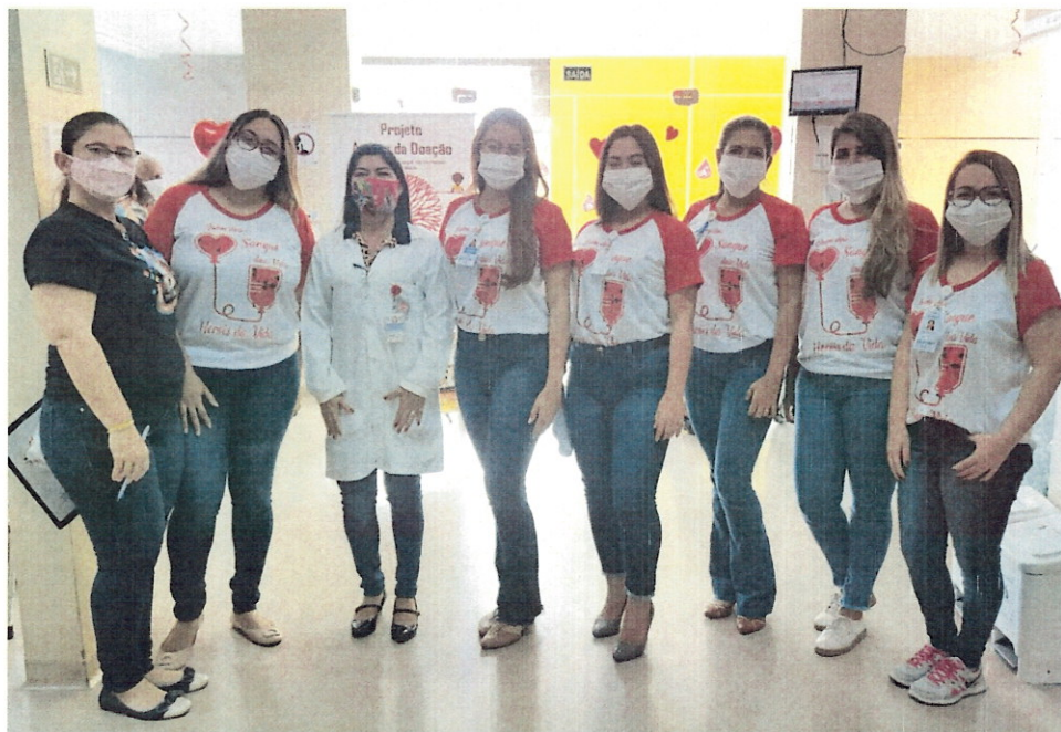
(Campanha doação de sangue)

2.11. Ações educativas para pacientes internados: Plantio de árvores, reforçando a importância com a preservação e cuidado com o meio-ambiente.