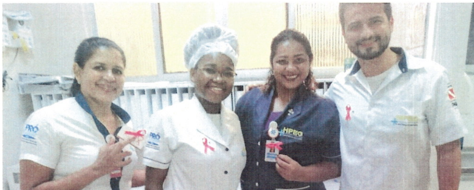
(Campanha Outubro Rosa)

2.5. Campanhas internas para prevenção e cuidados em saúde: Em parceria com instituições como a de Serviço Social do Comércio (SESC), foi disponibilizado a todas as colaboradoras, bem como a seus familiares, exames de mamografia; e para o colaborador masculino e familiares, exames de Antígeno Prostático Específico (PSA) e consulta com médico urologista.