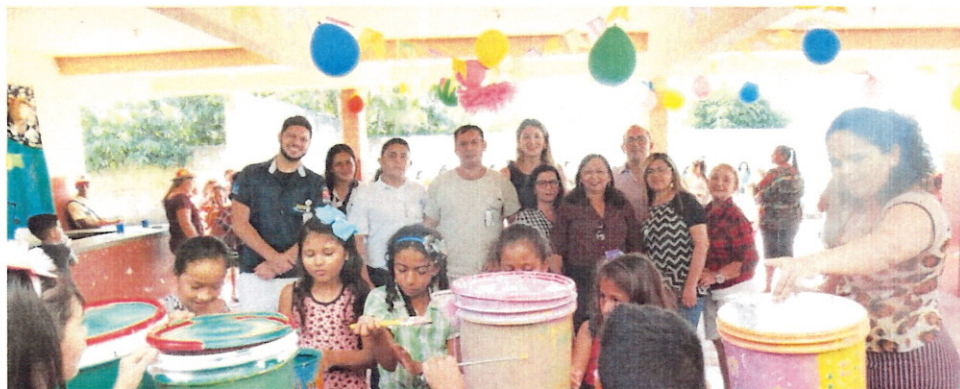
(Ação realizada pelo HPEG em escola estadual)

2.3. Ações sociais externas: Consistem em atividades realizadas pelas equipes do hospital junto a instituições carentes que atendem a crianças e idosos da comunidade; Palestras em escolas sobre diversos temas relacionados à sustentabilidade ambiental: como construir uma horta, modo de produzir composteira, como reciclar e como construir lixeiras a partir de materiais recicláveis.