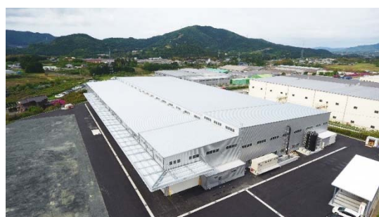
新城工場(2018 年 9 月稼働) 敷地面積: 約 27,000 m 2