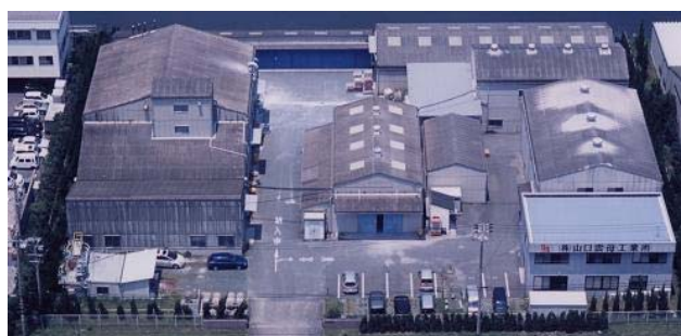
豊橋工場 敷地面積: 約 5,000 m 2