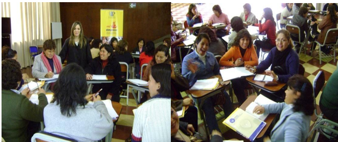
Capacitación a mujeres empresarias