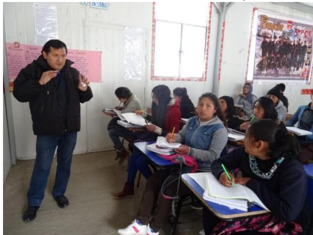
Clases del Programa de Nivelación Académica