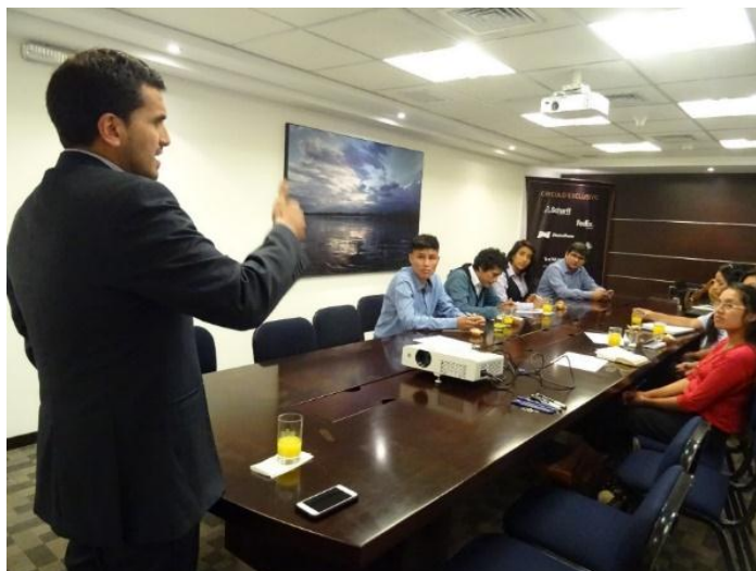
Talleres de Liderazgo