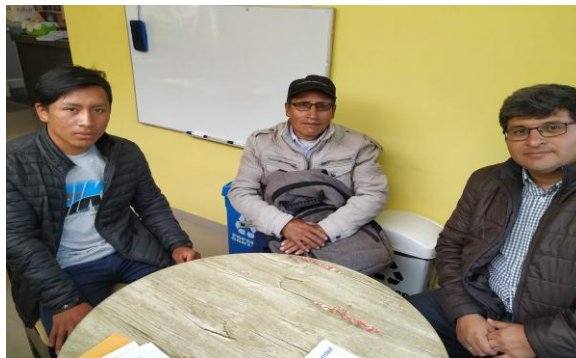
Entrega a Padres de Informes Académicos y Económicos

En nuestros programas de becas tenemos un 55% de mujeres estudiando en un centro de Estudio Superior.