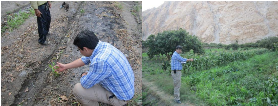
Capacitación en zonas agrarias

Asimismo, se ha logrado asociar y formalizar a comunidades agrícolas usualmente relegadas. Así, se han realizado más de 800 horas capacitaciones y 200 horas de consultorías para que estas comunidades puedan aspirar a financiamiento.