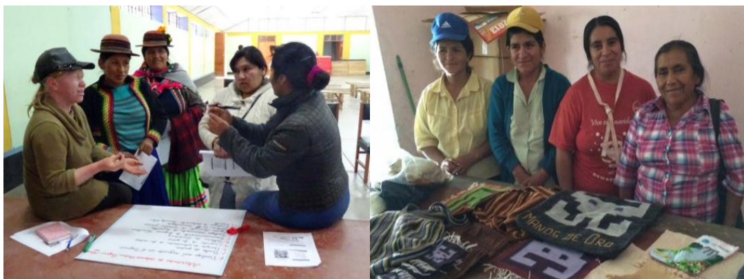
Capacitación formalizando a las mujeres emprendedoras