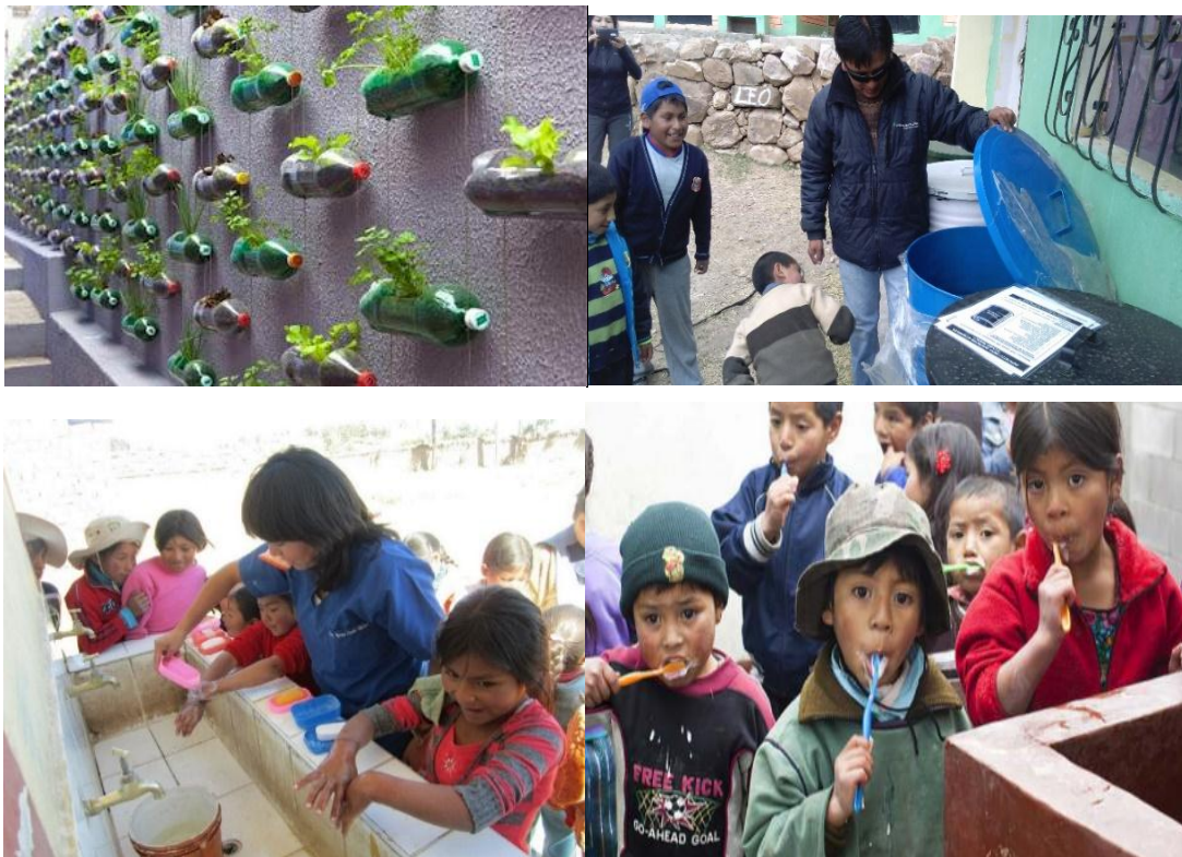
Educación en higiene y cuidado del medio ambiente

Asimismo, favorece de manera preventiva el medio ambiente al proponer proyectos de biohuertos escolares; además, favorece el desarrollo y la difusión de tecnologías respetuosas con el medio ambiente.