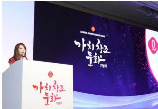
샤롯데 노사 현장