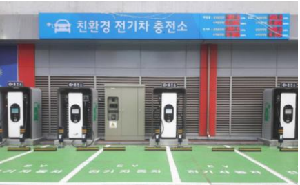
친환경 전기차 충전소 보급(마트)