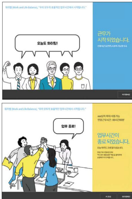
PC-OFF제 그룹사 확대

롯데그룹은 근로기준법 제 7조 강제 근로의 금지(폭행, 협박, 감금, 그 밖에 정신상 또는 신체상의 자유를 부당하게 구속하는 수단으로써 근로자의 자유의사에 어긋나는 근로를 강요하지 못한다)를 따르고 있으며, 근로기준법 17조에 따라 근로계약 시 근로조건을 명시하고 있습니다. 또한 고용노동부의 ‘근무혁신 10대 실천서약’에 따라 근무시간 효율화를 위한 ‘PC-OFF’ 제도를 전 계열사에 도입하여 근로시간을 관리하고 있습니다.