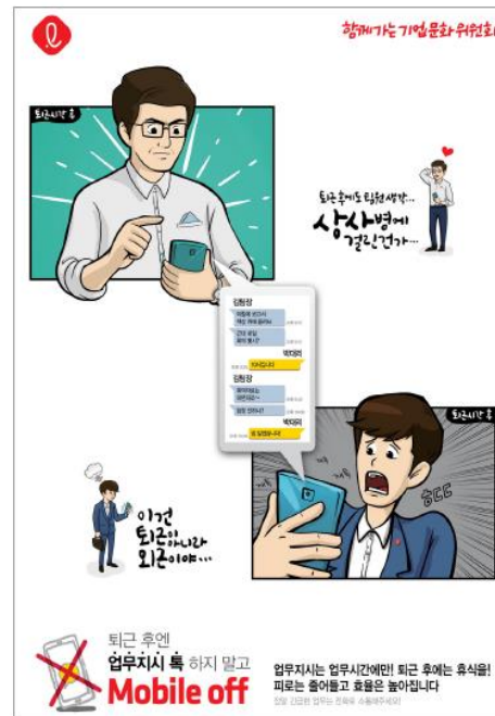
모바일 오프제 실시