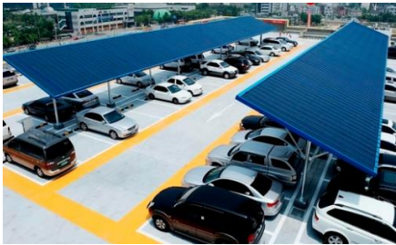
에너지 효율화 사례