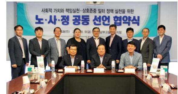
노사정 공동선언 협약식(제과)