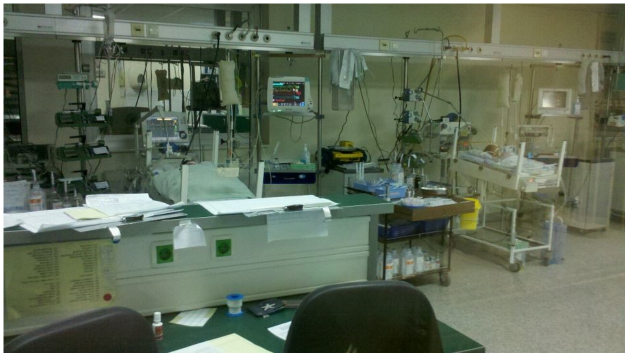
Institut „Dr Vukan Čupić“ – Odeljenje dečje kardiohirurgije

granama koje koriste visoko specijalizovanu i sofisticiranu tehnologiju koja zahteva značajna sredstva, tako da je, zbog ograničenih finansijskih resursa, za razvoj ove medicinske grane bila neophodna dodatna podrška donatora. Aprila 1992.godine, zbog nedostatka lekova i potrošnog materijala, kardiohirurški tim je prestao da radi i na listi čekanja ostavljeno je oko 400 dece sa urođenim srčanim manama. Zahvaljujući radu Fondacije normalizovani su uslovi za obavljanje kardiohirurških intervencija i kardiološkog lečenja dece - od novorođenčadi do 18 godina starosti. Najmanja beba operisana na otvorenom srcu bila je teška kilogram i sedam stotina grama, a na zatvorenom srcu - svega devet stotina grama.