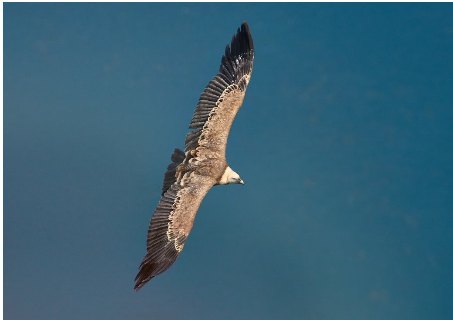
Beloglavi sup ( Gyps Fulvus )

Koa što smo istakli simbol rezervata je Beloglavi sup ( Gyps Fulvus ) retka vrsta orla - lešinara. Ova vrsta je ranije naseljavala šire područje zapadne Srbije, da bi sredinom 20.veka, usled ubrzane industrijalizacije, napustila sva staništa u zemlji. Samo zahvaljujući radu Rezervata Uvac, uz značajnu pomoć domaćih i inostranih organa vlasti i nevladinih organizacija, uspelo je ponovno naseljavanje (reintrodukcija) beloglavog supa u Rezervatu.