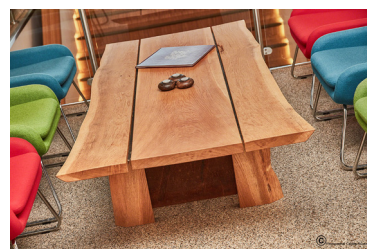
Et lille udpluk af de produkter som ReDo fremstiller af materialer fra de bygninger vi nedriver.