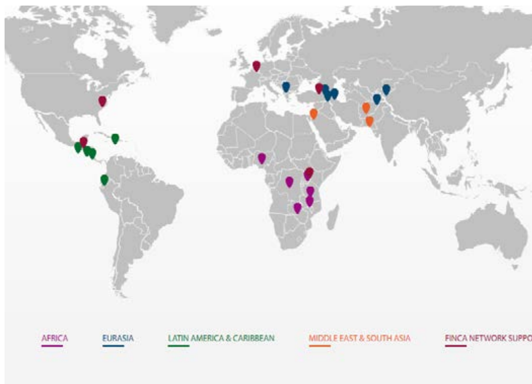
Présence de FINCA dans le monde