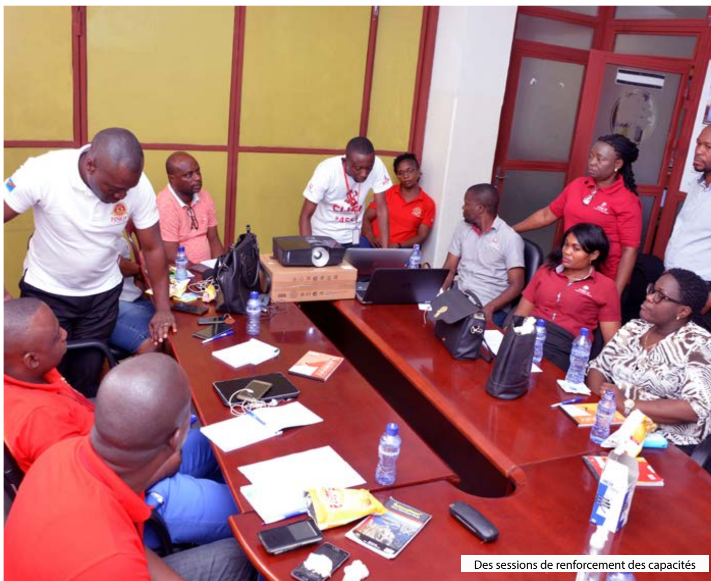
Des sessions de renforcement des capacités

INVESTIR dans le potentiel des personnes NOURRIR (ENTREtenir) des relations de confiance à long terme SURPRENDRE et impressionner par notre service POURSUIVRE la croissance et l'apprentissage INNOVER et continuellement améliorer RÉCOMPENSER l'intégrité, la responsabilité et l'engagement EXCELLER dans ce que nous faisons SERVIR au-delà de soi.