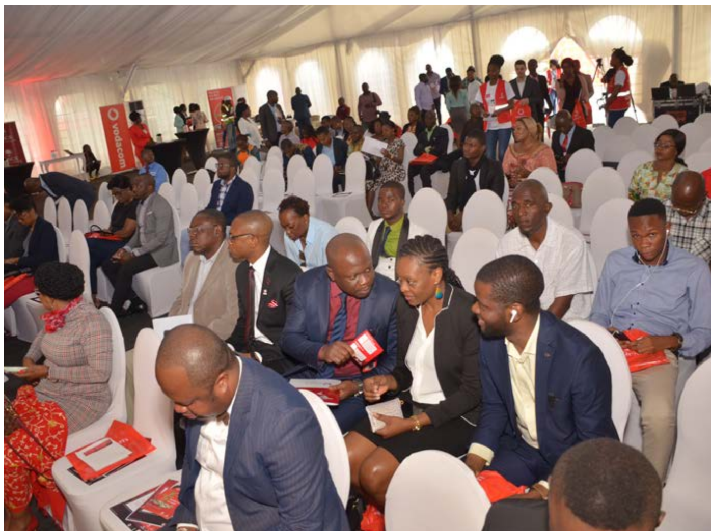
Lancement LONA O DEFA avec Vodacash

Enfin, périodiquement, FINCA organise, pour ses agents, des formations en ligne sur Sécurité Informatique, Harcèlement, et autres.