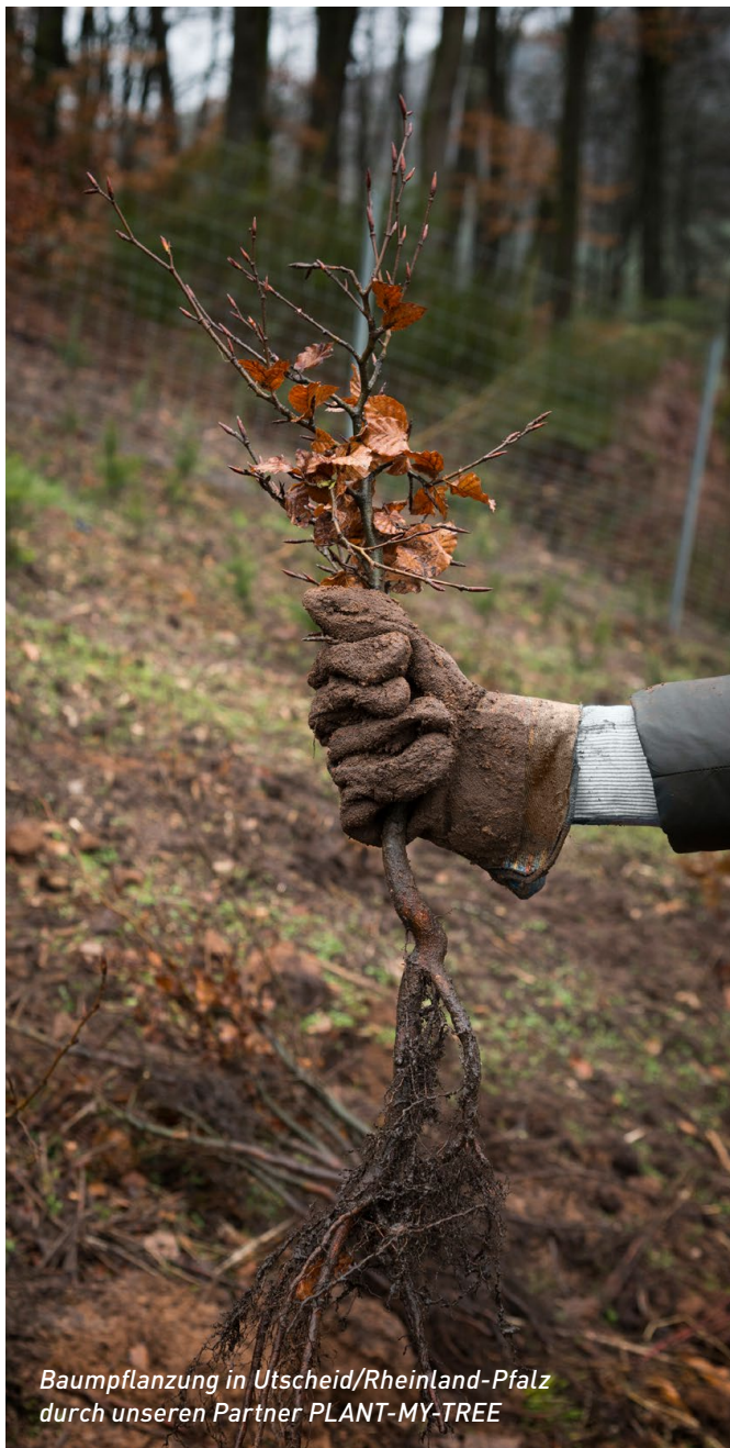
Baumpflanzung in Utscheid/Rheinland-Pfalz durch unseren Partner PLANT-MY-TREE

Wir freuen uns sehr, denn wir glauben: Offenheit ist eine der wichtigsten Voraussetzungen für Kreativität. Sie macht die Welt bunter, verständlicher, lebendiger und besser.