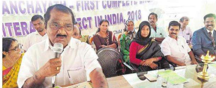
മാവൂരിനെ രാജ്യത്തെ ആദ്യ സമ്പൂർണ്ണ ഇംഗ്ലീഷ് സാക്ഷരതാ പഞ്ചായത്താക്കി മാറ്റുന്ന പദ്ധതി പുറപ്പെടുവിക്കുകയുണ്ടായി എം.എൽ.എ ഉദ്ഘാടനം ചെയ്യുന്നു.