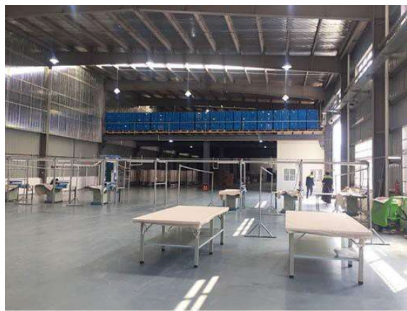
Almacén de Simei en China: N° 2, Pengqing Street, Kunshan, Jiangsu Province, China.

PLANCHADO: Capacidad 45.000 prendas/día china y 50.000 en Holanda 5 TÚNELES DE PLANCHADO: 1000 pcs/h 6 MÁQUINAS DE PLANCHADO MANUAL: 180 pcs/h CLASIFICADO: PERCHAS