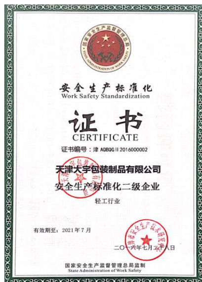
ISO9001/ISO14001/安全生产标准化证书