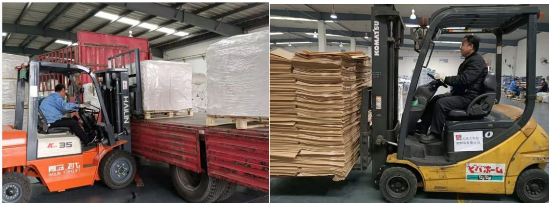
公司的装卸机械化作业

为了减少重复笨拙的体力劳动，降低事故率，加大作业安全度，同时为了提高工作效率，加快物资周转速度，公司仓库使用叉车进行作业，不仅保证了公司的安全生产，同时也大幅度提升了工作效率，经济效益十分显著。