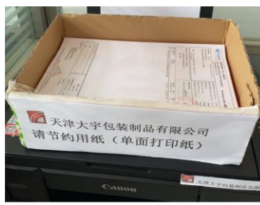
办公室环保宣传及节约用纸