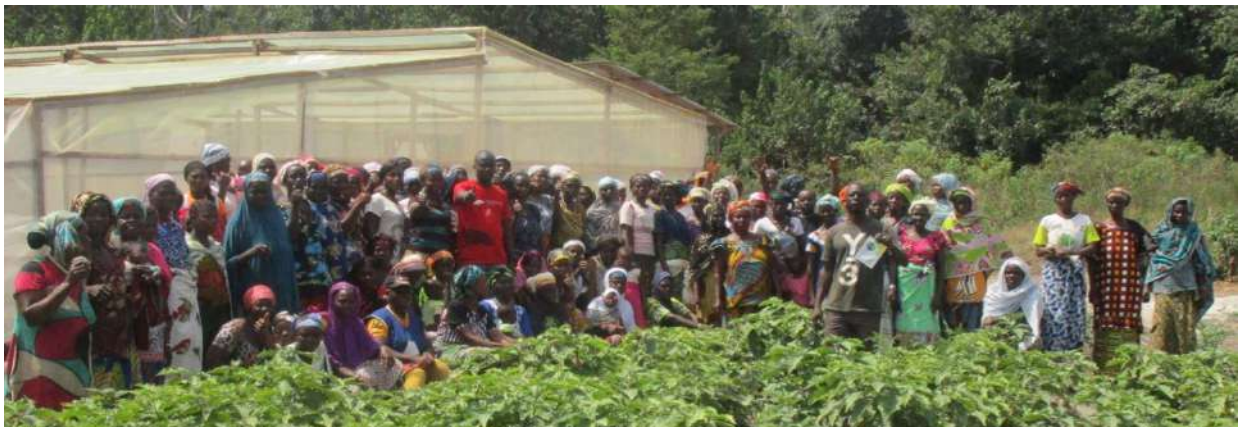
Photo 7: Association de femmes devant la première serre du village