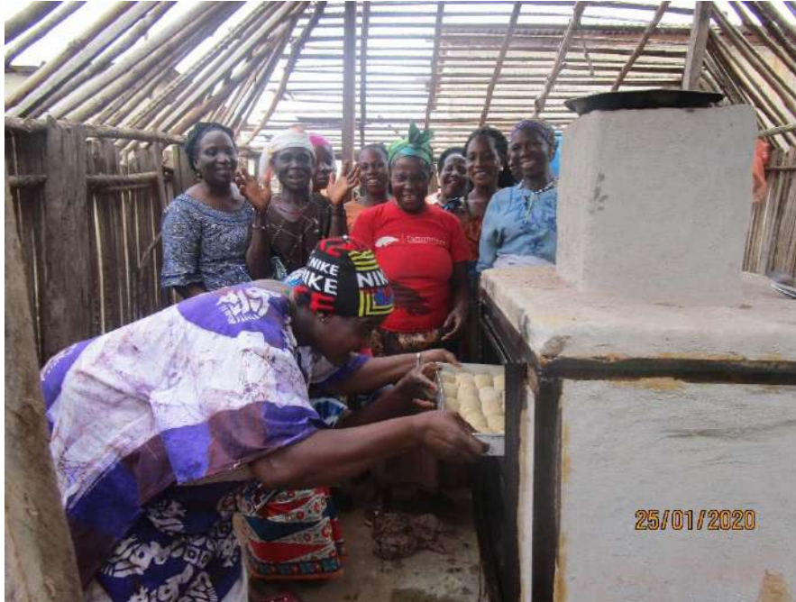
Photo 4: Association de femmes avec leur four à pain pendant un cours de nutrition