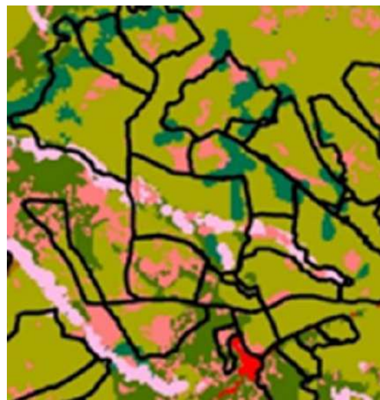
Figure 2: Évaluation de l'intérieur des exploitations de cacao