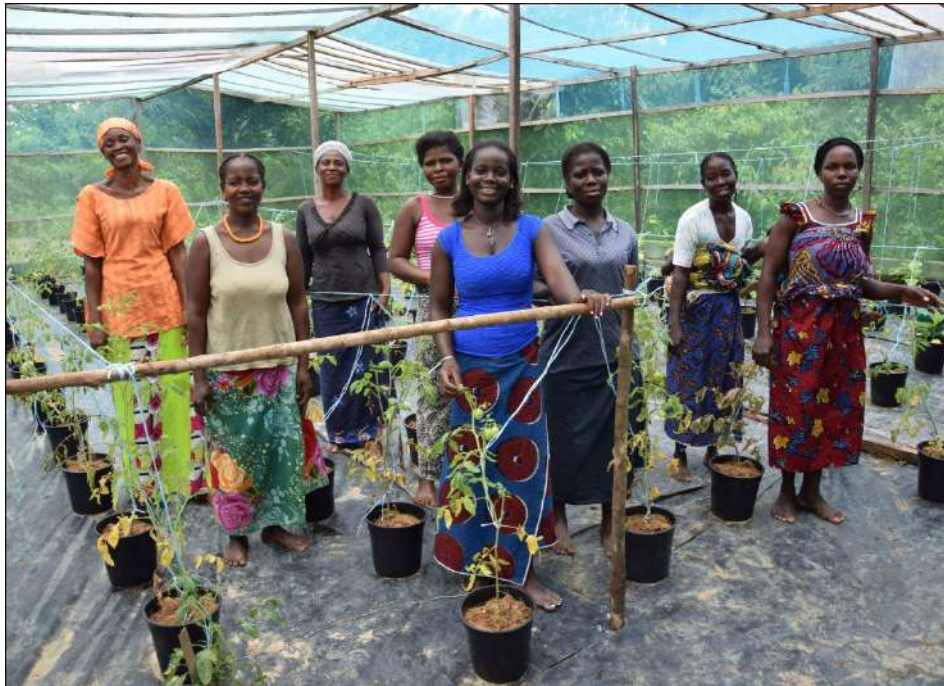
Photo 3: Association de femmes et premières plantations de tomates