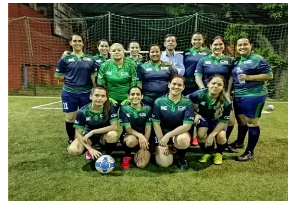
Participación en Torneo Femenino INTER EMPRESARIAL organizado por la Liga Empresarial Femenina y disputado en Pilsen Arena de Fanáticos del Fútbol.