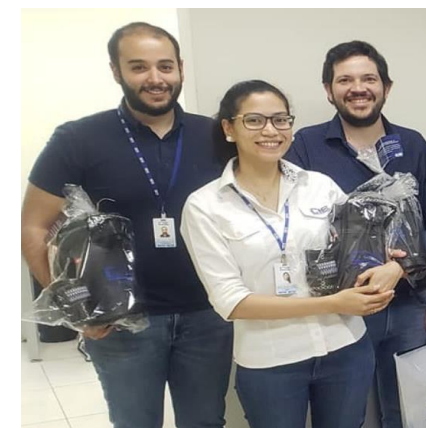
Como obsequio de fin de año entregamos 650 termos de mate/tereré con guampa para todos nuestros colaboradores.