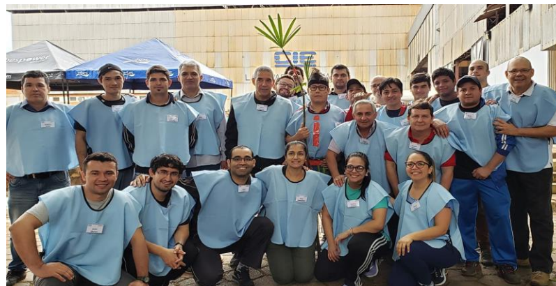
El Festejo del Día del Trabajador fue celebrado con una Yincana de integración inter áreas y un almuerzo previsto para 350 colaboradores.