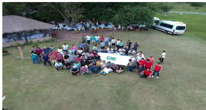
Celebramos 3 festejos; un After office en planta industrial para 400 colaboradores, un almuerzo con 60 colaboradores de Ciudad del Este y un almuerzo previsto para 120 colaboradores de la Ciudad de Ayolas.