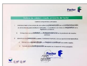
Ilustración 5: Política de Calidad y Medio Ambiente de Factor