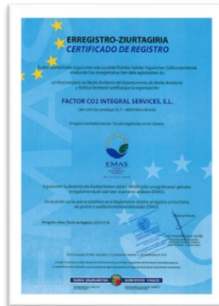
Ilustración 3: Certificado de inscripción en el Registro Comunitario de Gestión y Auditoría Medioambientales (EMAS)

Factor realiza, desde el año 2008, su Declaración Ambiental, reflejo de su responsabilidad con el entorno sin dejar a un lado la calidad de sus servicios, que puede solicitarse públicamente a través de la página web o el contacto facilitado por la organización.