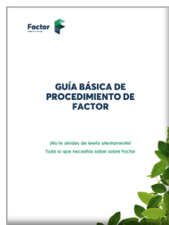
Ilustración 1: Portada del Manual de Organización elaborado por Factor

Como propuesta de mejora, durante dicho año se ha establecido el objetivo de ampliar el documento Manual de Organización, de manera que aúne toda la información relevante de la empresa en cuanto a áreas de trabajo, protocolos de actuación, prevención de riesgos laborales, anexos explicativos en torno a las herramientas de trabajo, etc.