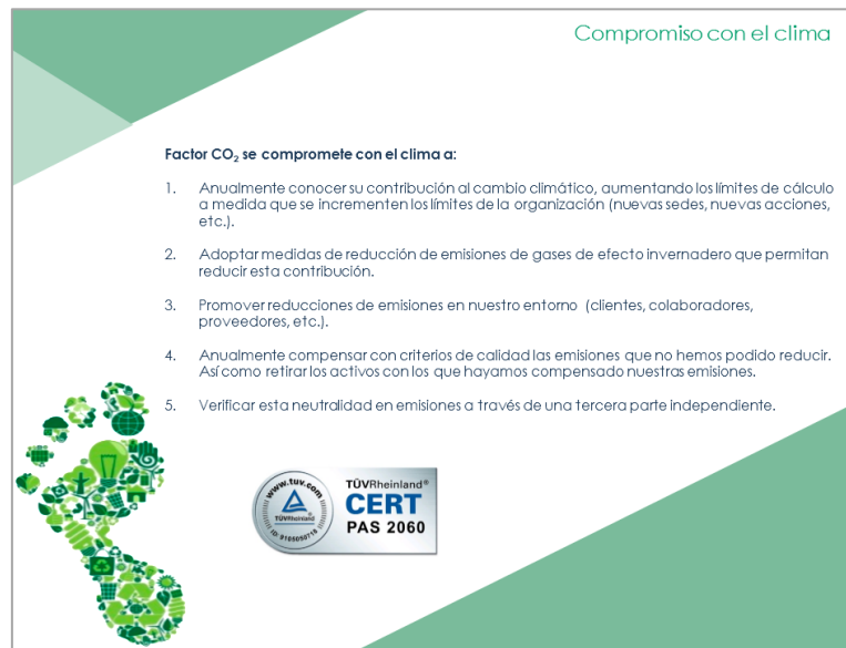
Ilustración 6: Compromisos con el clima de Factor

En relación con ello, la organización ha incorporado una línea específica de compromisos con el clima: