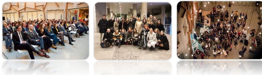
Ilustración 4: Imágenes de jornadas de capacitación en las que ha participado Factor durante 2019

Por otro lado, en 2019 la organización ha participado en diversas jornadas de temáticas relacionadas con la protección del medio ambiente y el desarrollo sostenible. En este sentido, Factor considera de vital importancia continuar con este tipo de difusión, tanto social como empresarial, de cara a promover el crecimiento verde como uno de los pilares fundamentales de su filosofía. Es por ello por lo que se promueve en su comunicación a través de las herramientas de difusión existentes como la página web, las redes sociales o los boletines informativos editados por Factor de manera gratuita, así como en las notas de prensa elaboradas a este respecto.