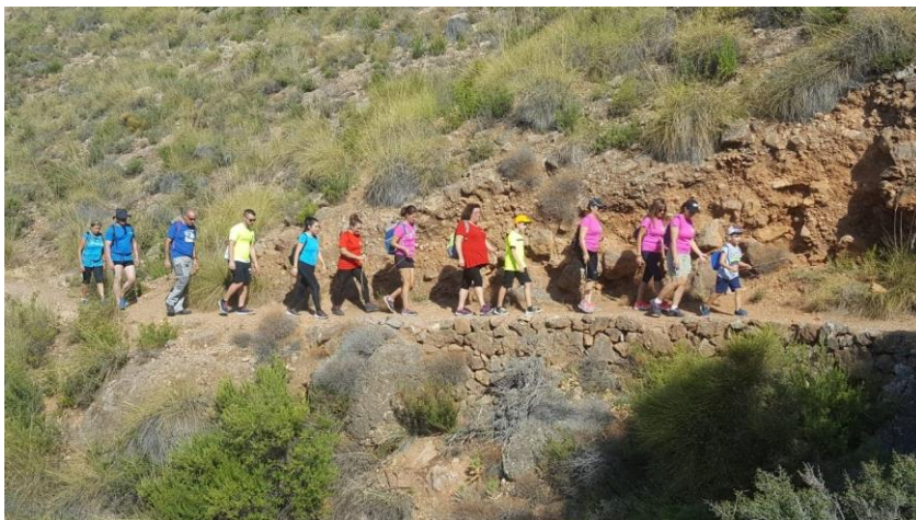
Ruta por el Berja (Almería)