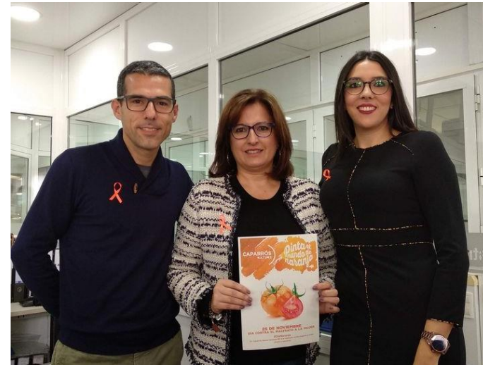
Trabajadores de la empresa con el cartel del día contra el maltrato a la mujer.

Para el año 2020, con la finalidad de cumplir con los objetivos de Principio 1, se encuentran las siguientes acciones: