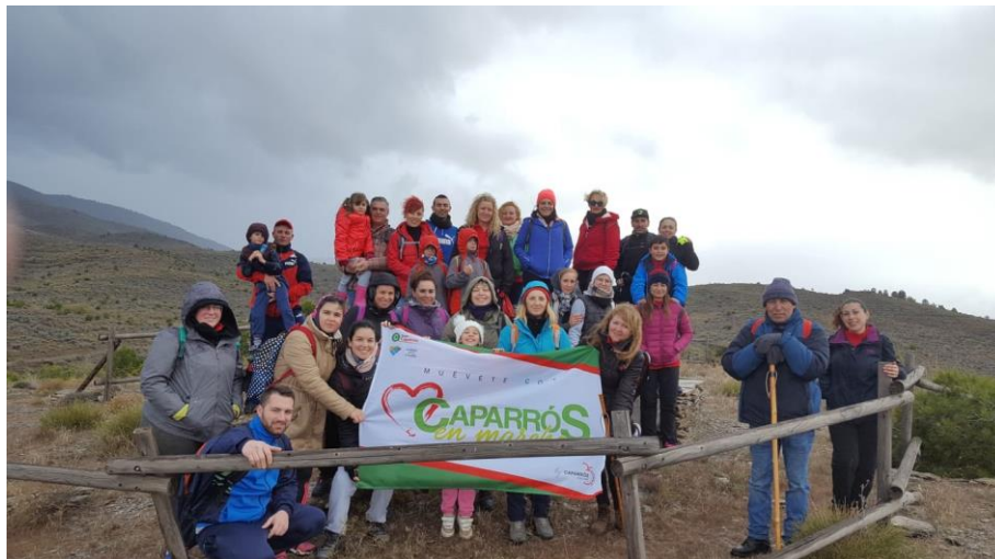
Ruta por los Molinos y Fuentes de Abia con los trabajadores y familiares de Grupo Caparrós, dentro de programa Caparrós en Marcha..