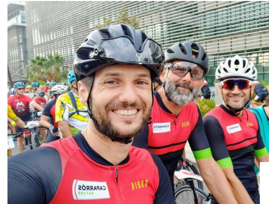
IV Ruta de Ciclismo Caparros Nature en la Semana de la Movilidad