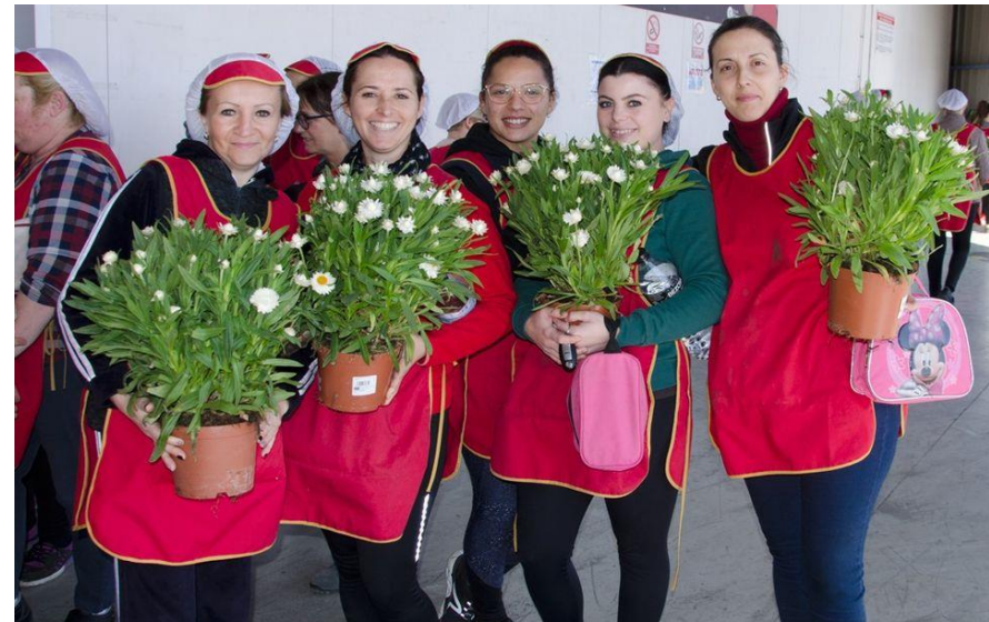
Celebración del día de la Mujer Trabajadora de 2019.

La empresa garantiza que todos sus trabajadores tengan la posibilidad de organizarse, formar o afiliarse a las organizaciones sindicales que así estimen oportuno, sin temor a tener ningún tipo de represalias ni privación de ningún derecho laboral.