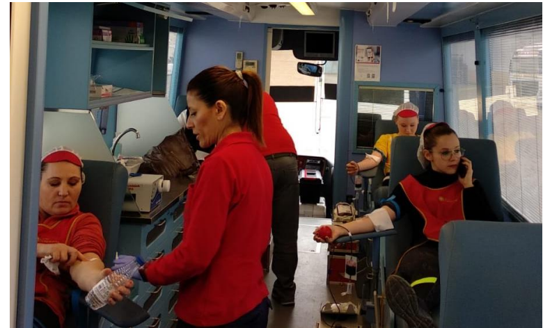
Campaña de donación de sangre en colaboración con el Centro de Transfusión Sanguínea de Almería.

La empresa cuenta con puestos de responsabilidad ocupados tanto por hombres como por mujeres, huyendo de roles de género en los puestos de trabajo de cualquiera de las actividades desarrolladas en el desempeño diario de trabajo. Desde el mes de Julio de 2019 el Grupo Caparrós tiene implantado un Plan de Igualdad, que se complementa con una Guía de Comunicación de Lenguaje no Sexista y una Comisión Contra el Acoso por Cuestión de Género.