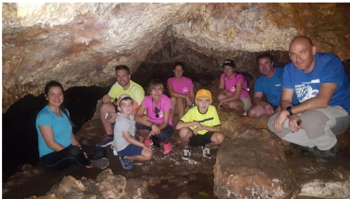
Visita a la galería Morales (Almería).