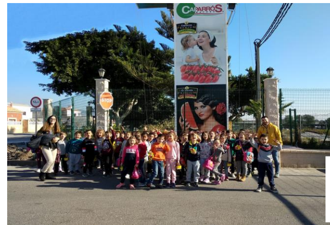
Visita a nuestras instalaciones de alumnos de secundaria.

Se han realizado un número importante de talleres de sobre alimentación saludable por colegios de primaria de la provincia, hemos colaborado con Ecoescuelas.