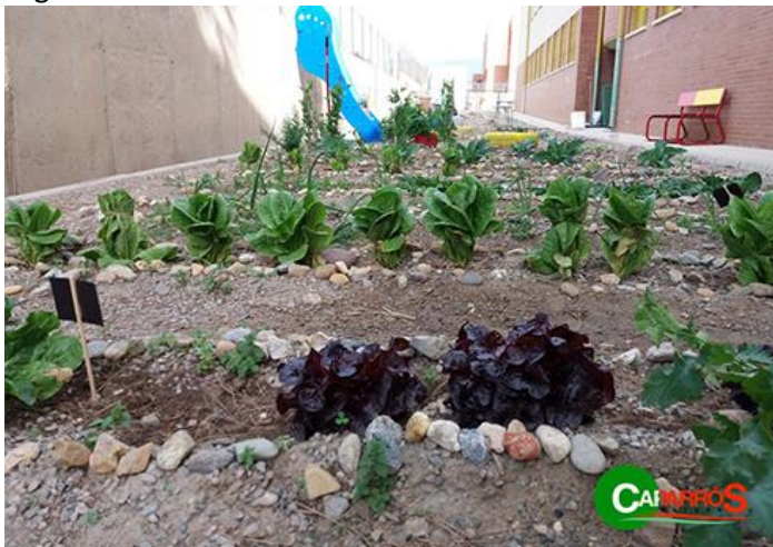
Huerto Escolar en un colegio de Almería Capital promovido por Grupo Caparrós.

Entre los recursos ambientales más amenazados en nuestro entorno, está la cada vez mayor falta de agua, sin duda debido a los efectos del cambio climático en el Sureste peninsular. Por este motivo, la empresa cada año sigue reforzando las iniciativas que tengan como objetivo una correcta gestión y ahorro de este recurso vital. Entre las iniciativas al respecto destacan: