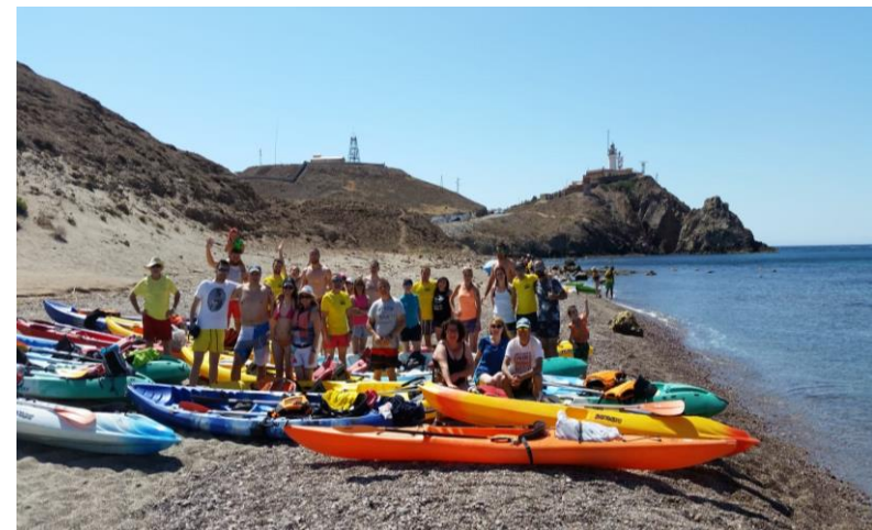
Ruta en Kayak por la calas del Parque Natural de Cabo de Gata-Níjar (Almería)