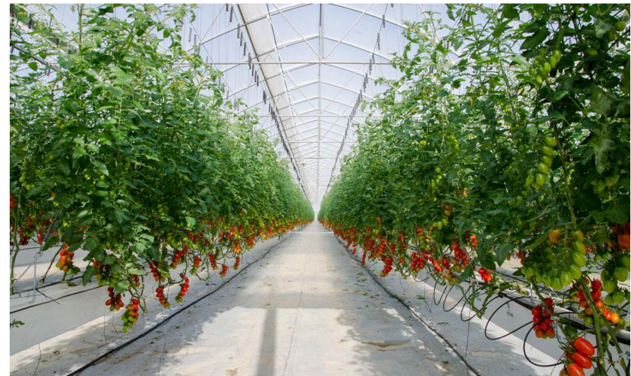
Finca de tomate Lobello con sistema de ahorro de agua NGS en Almería.