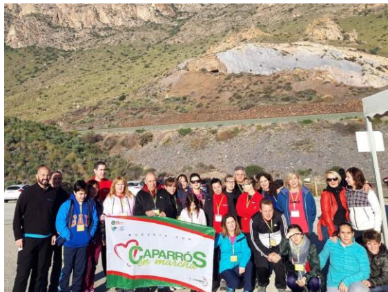
Visita a la Geoda de Pulpí, actividad enmarcada en Caparrós en Marcha.

Este año además, la empresa ha firmado la Declaración de Luxemburgo y está adherida a la estrategia de Promoción y Salud en el Lugar de Trabajo, cuyo objetivo es la que las personas que componen la empresa tengan acceso a conocimiento y habilidad sobre alimentación saludable, actividad física, gestión de control de estrés, haciendo el entorno de trabajo más saludable.