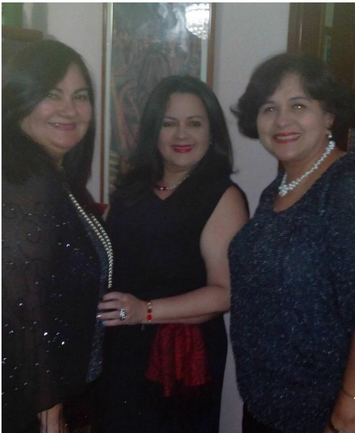
Equipo Directivo de CONSIVE

Consultores Integrales de Venezuela (CONSIVE) Maracaibo, Estado Zulia. Venezuela Dirección: Av 81 A Urbanización La Rosaleda No 82-179 Teléfono: 58-04140681688 Correo: elsaconsive@hotmail.com