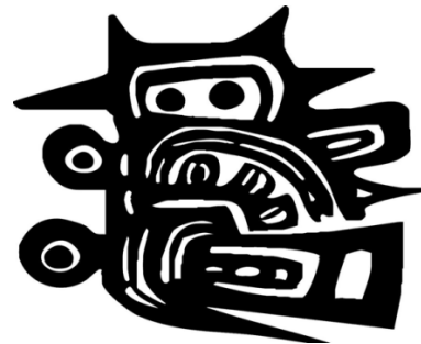
Logo Facultad de Humanidades y Educación LUZ