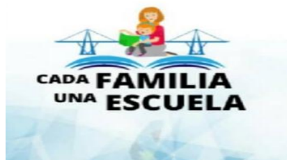
Ministerio del Poder Popular de Educación Logo del Programa Cada Familia Una Escuela