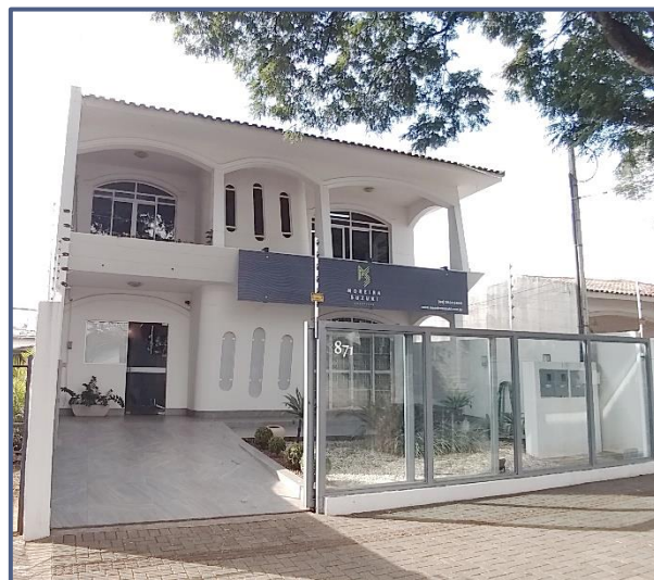
Figura 1 - Fachada da Sede da Moreira Suzuki Advogados

O core business da Moreira Suzuki é a prestação de serviços de advocacia e consultoria jurídica.