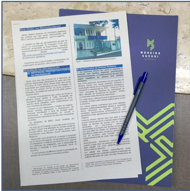
Figura 3 – Kit boas-vindas, parte do programa de integração dos novos participantes da equipe Moreira Suzuki

Outro indicador de cumprimento aos princípios ligados ao trabalho é a Pesquisa de Clima Organizacional, realizada no 1º semestre de 2019; 96% dos que responderam indicariam um amigo para trabalhar no escritório.