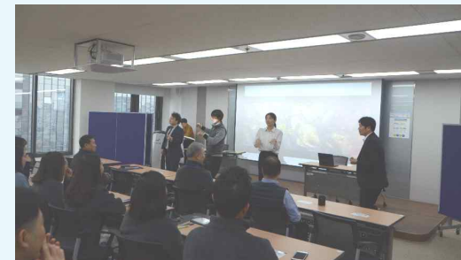
연극형식 청렴 교육