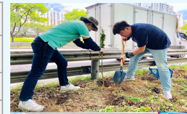
샛강 나무심기 활동