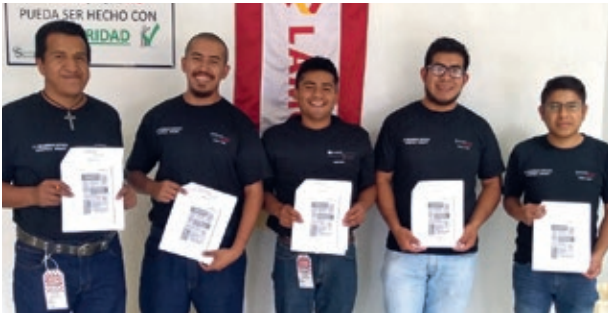
Programa "Hagámoslo bien", planta revestimientos Porcel