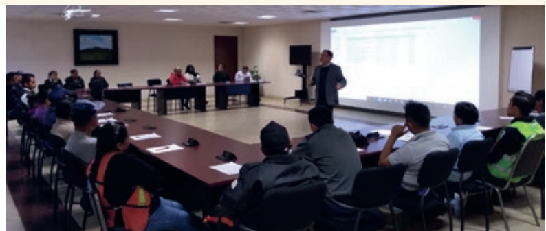
Capacitación en legalidad, planta revestimientos Pavillion