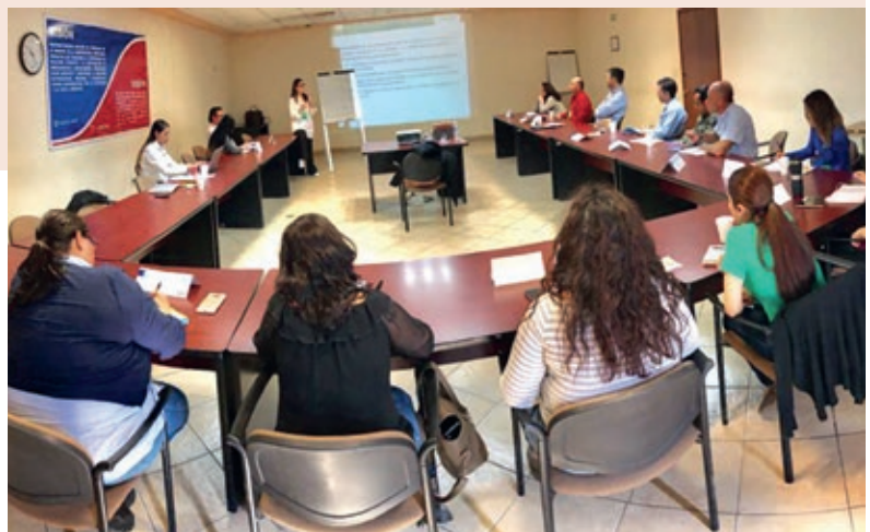
Diplomado en cultura organizacional, planta revestimientos Querétaro

Se mantuvo una participación activa con el Centro de Competitividad (CCMX) en Monterrey y la Ciudad de México, transmitiendo las mejores prácticas a nuestros proveedores con la finalidad de potencializarlos. Algunos de los programas de profesionalización impartidos fueron los de Estrategia Comercial y el de Cultura Organizacional, entre otros.