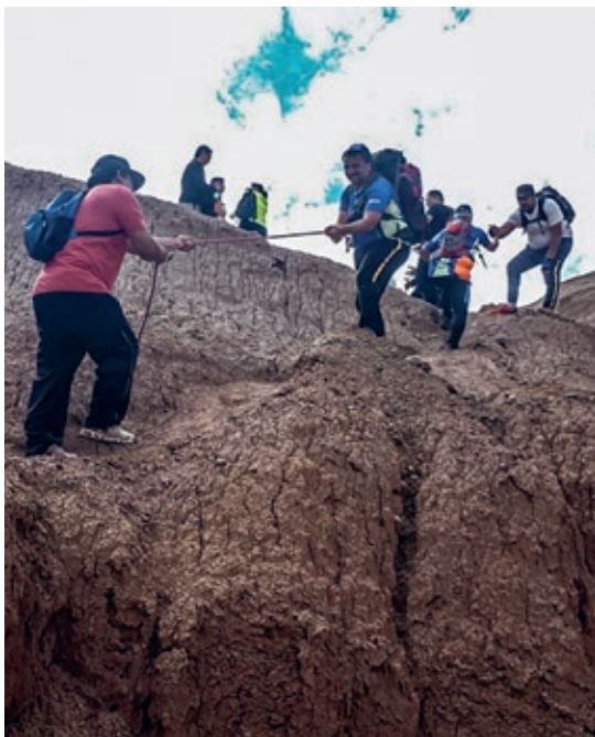
Actividad de Trekking por personal en Argentina