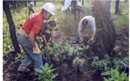
Reforestación en la comunidad de San Marcos, Contla, Tlaxcala. Planta revestimientos Porcel