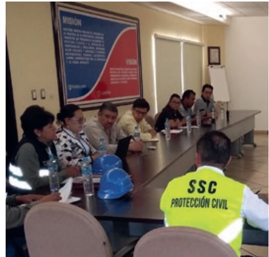
Capacitación en seguridad, planta revestimientos Gres