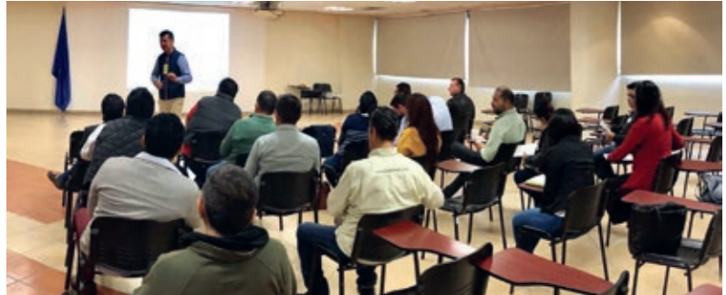
Diplomado en estrategia comercial, planta revestimientos Querétaro

Adhesión de proveedores al cumplimiento del Código de Ética de Grupo Lamosa.