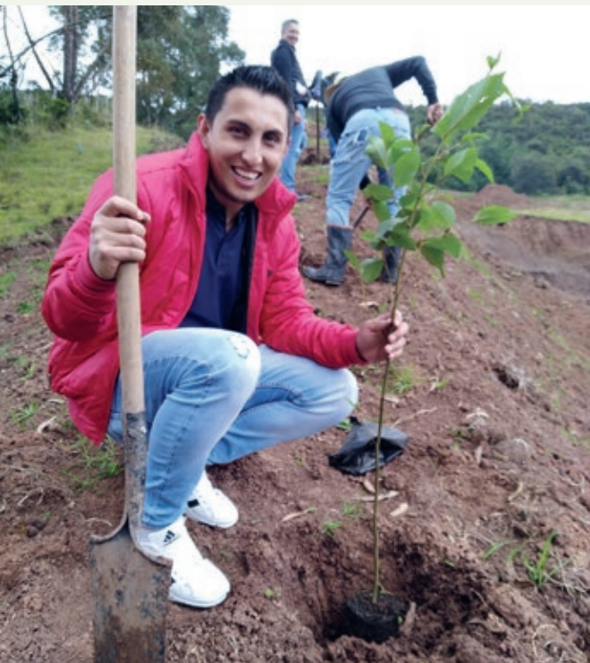
Reforestación en mina en Tausa, personal planta Colombia