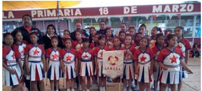
Programa "Escuela digna", planta revestimientos Gres, Escuela primaria 18 de Marzo.