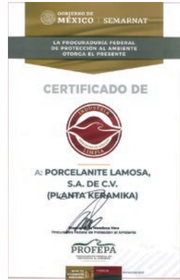
Certificado de Industria Limpia