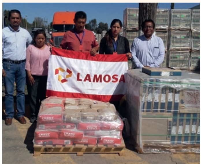
Programa "Escuela digna", planta revestimientos Keramika, Escuela primaria Emiliano Zapata en Ixtacuixtla, Tlaxcala

Durante el año se le dio seguimiento al programa "Escuela Digna" en Tlaxcala, apoyando con material y mano de obra a planteles educativos con necesidades en las aulas, con la finalidad de asegurar que hijos o familiares de los trabajadores de Lamosa, cuenten con un espacio digno en el cual puedan realizar sus estudios. A la fecha se han apoyado a 22 instituciones educativas (Preescolar, Primaria, Secundaria y Preparatoria), beneficiando directamente a más de 2,000 niños.