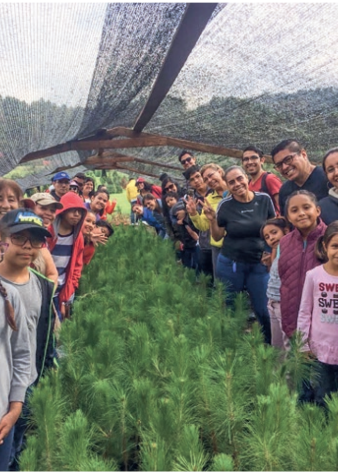
Reforestación en Bosque Esmeralda, Edo. de México, Oficina Bosques