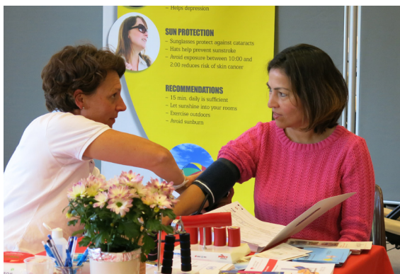
Photos de l'Expo Santé® 2016 Expo réalisée également en 2017, 2018 et 2019