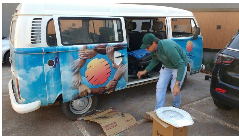
DESTINAÇÃO SOLIDÁRIA DE MATERIAIS DA CONSTRUÇÃO CIVIL