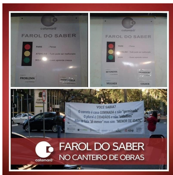
FOTO 1: PLACA DO FAROL DO SABER, NA OBRA DA CATAMARÃ E FAIXA DO SINAL DO SABER, NA CIDADE DE MARINGÁ.

Faixas feitas com material reciclável são levadas para locais públicos, principalmente semáforos. Basta o sinal ficar vermelho para que painéis entrem em cena chamando a atenção dos motoristas e pedestres para erros comuns. As mensagens são curtas e diretas como: “O certo é meio-dia e meia e não meio-dia e meio” e “Não é perda de tempo mas perda de tempo”. Uma maneira de melhorar o nível cultural da cidade. O projeto é custeado por empresas e profissionais liberais que se tornaram apoiadores culturais e tem seus nomes divulgados nos painéis. A Catamarã implantou o projeto, rebatizando-o Farol do Saber, (FOTO 1) placa que fica localizada em local de grande fluxo de funcionários, próxima aos lavatórios e bebedouros. A cada 15 dias são colocadas 4 palavras comumente utilizadas de forma errônea no canteiro de obras. Termos como “BETONEIRA” e não “bitorneira”; o correto é “COLHER” e não “cuié” são apresentados aos mais de 100 funcionários e estes se tornam mais cuidadosos ao utilizar as palavras além de levarem o que aprenderam, durante o trabalho, para casa, disseminando esse conhecimento a toda família.