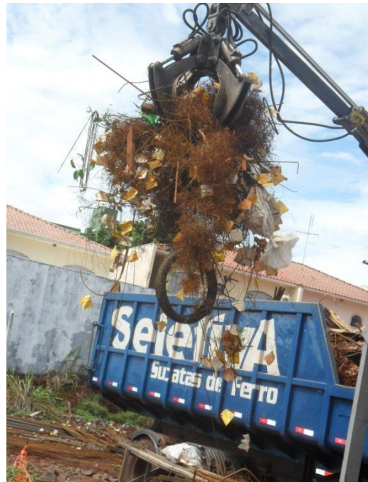
DESTINAÇÃO SOLIDÁRIA DE AÇO