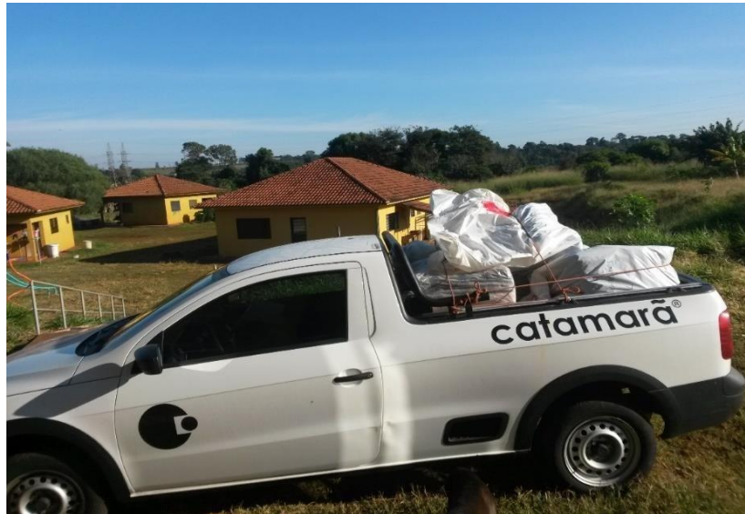
DOAÇÃO DE COBERTORES PARA A ASSOCIAÇÃO INDIGENISTA ASSINDI MARINGÁ