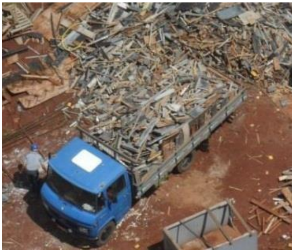
DESTINAÇÃO SOLIDÁRIA DE MADEIRA

A Catamarã pode ser considerada empresa exemplo de solidariedade e cidadania, além da competência nos serviços e produtos oferecidos. Prova disso é o Tetracampeonato no Prêmio Sinduscon-Nor/PR, onde foram avaliadas 18 construtoras da cidade de Maringá e região, que integram o ranking das empresas com melhores práticas em busca de qualidade. Os critérios de avaliação foram: qualidade em gestão; segurança no trabalho; sustentabilidade e o manejo correto de resíduos sólidos; responsabilidade social.