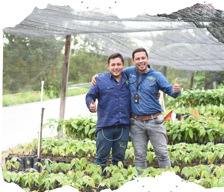
Trabajo en equipo