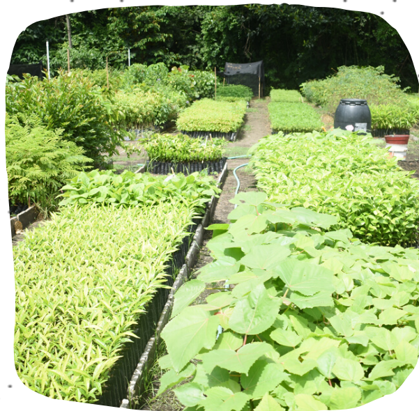
Conservamos el medio ambiente