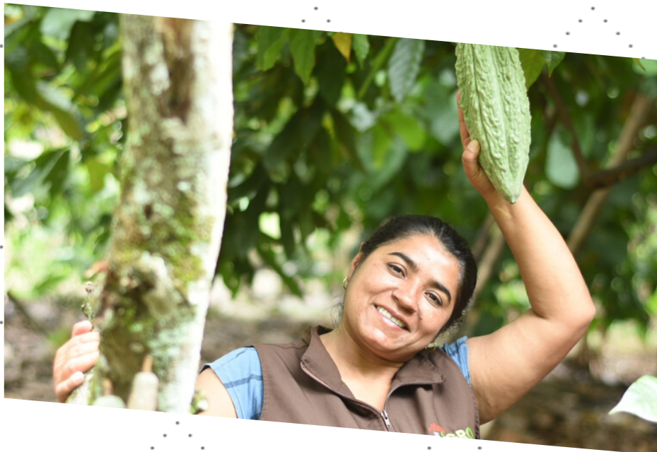
Reconocemos la importancia de la mujer en ECO YUMA S.A.S.