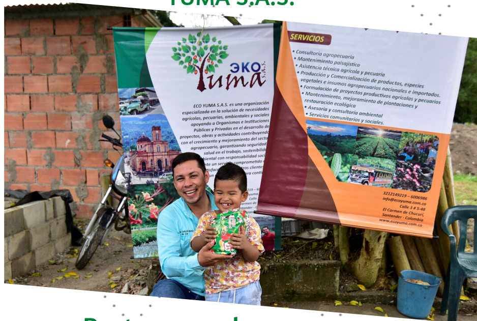
Protegemos las nuevas generaciones