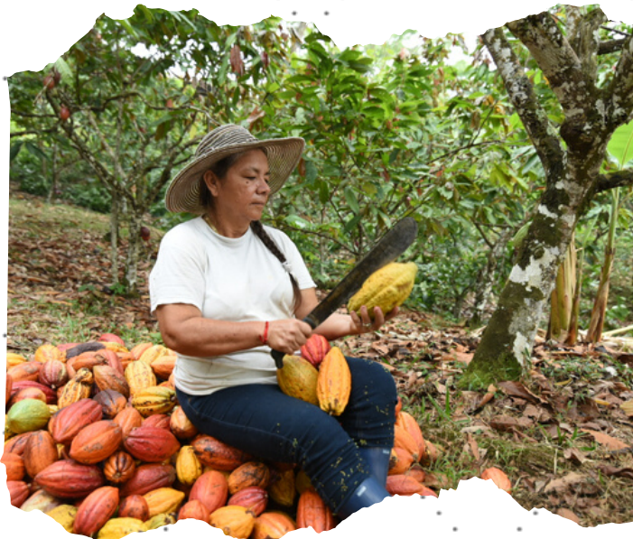
Trabajo a madres cabezas de hogar