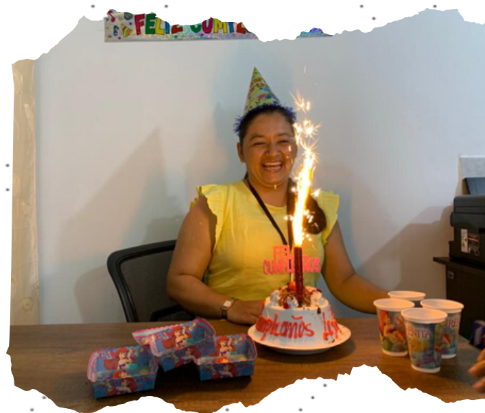
Celebración de cumpleaños a trabajadores