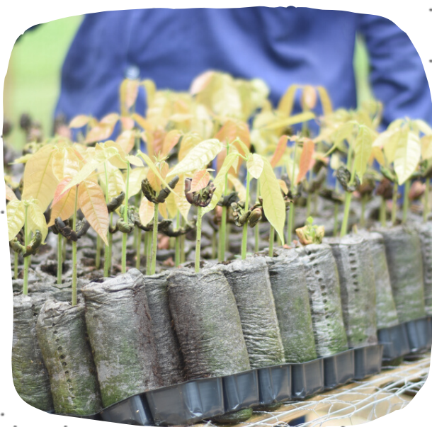
Uso de nuevas tecnologías