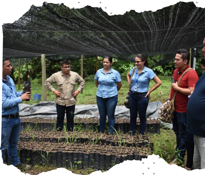
Potencializamos nuestros talentos