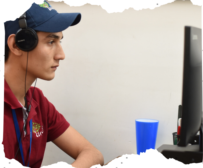
Implementación de nuevas tecnologías