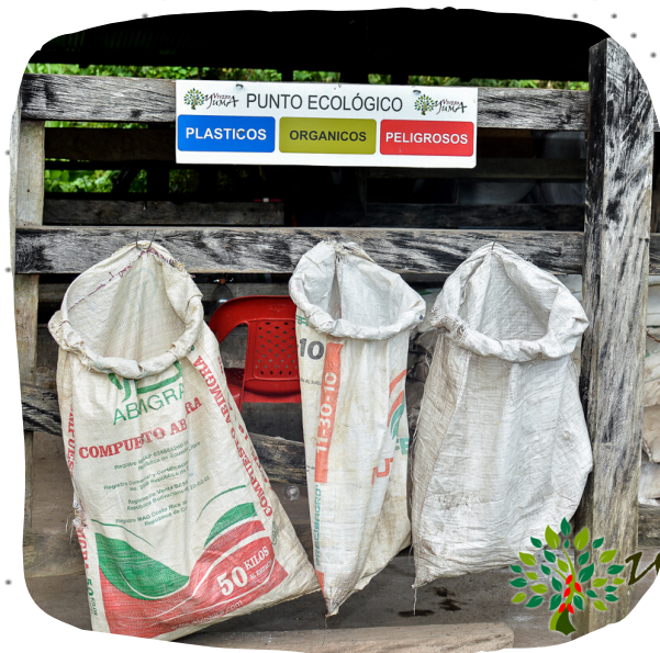
Manejo de residuos sólidos