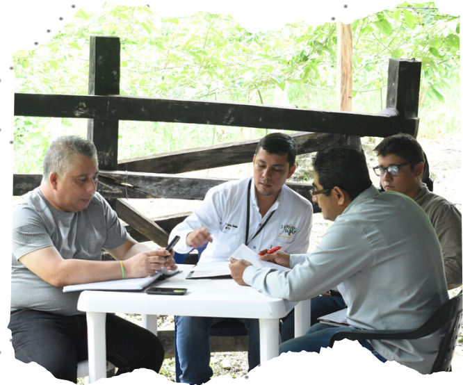
Auditorías para la implementación del SGI