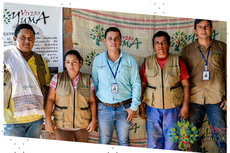
Equidad de género