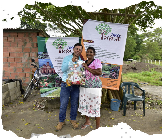
Detalle en fecha decembrina