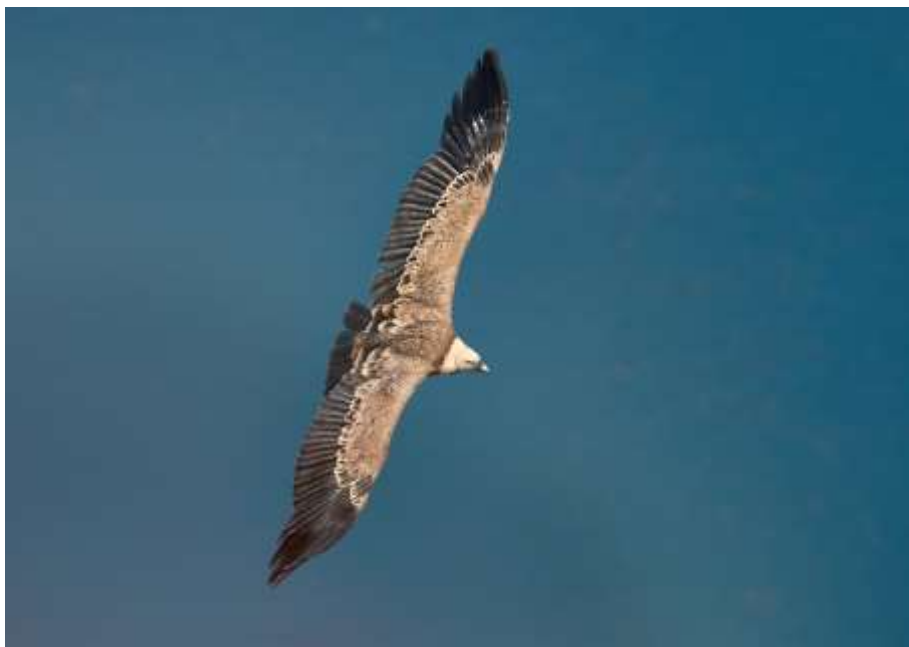
Beloglavi sup (Gyps Fulvus)