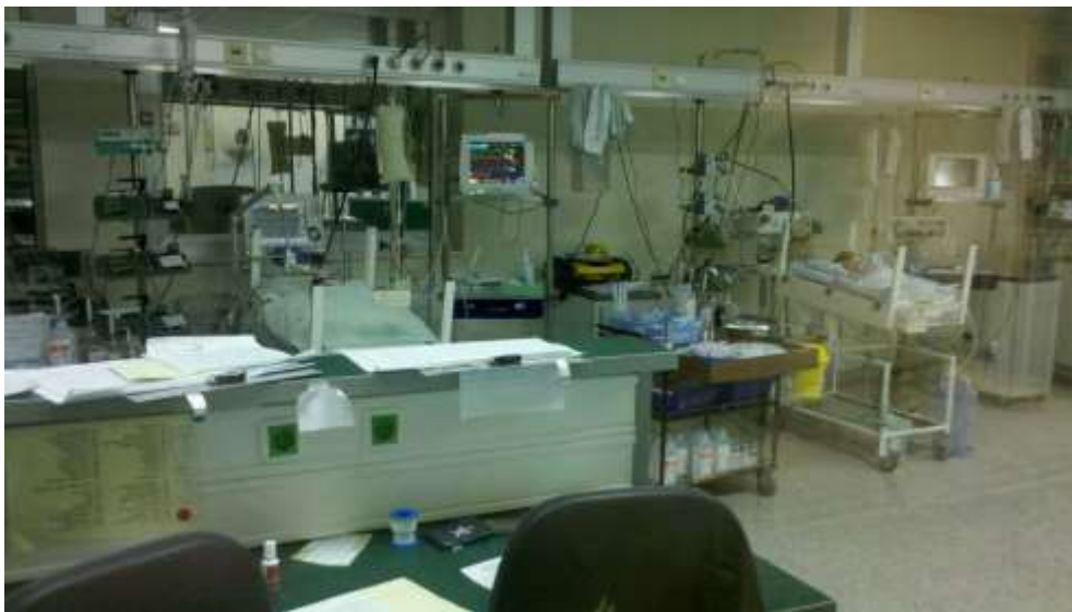
Institut „Dr Vukan Čupić“ – Odeljenje dečje kardiohirurgije

Kao ključni osnivač, Banka daje punu podršku realizaciji ovog humanog projekta koji u potpunosti potvrđuje našu trajnu orijentaciju na poštovanje univerzalnih etičkih principa koji su osnov naše korporativne filozofije, odnosno trajnu posvećenost potrebama lokalne zajednice, a posebno brizi o zdravlju najmlađih.