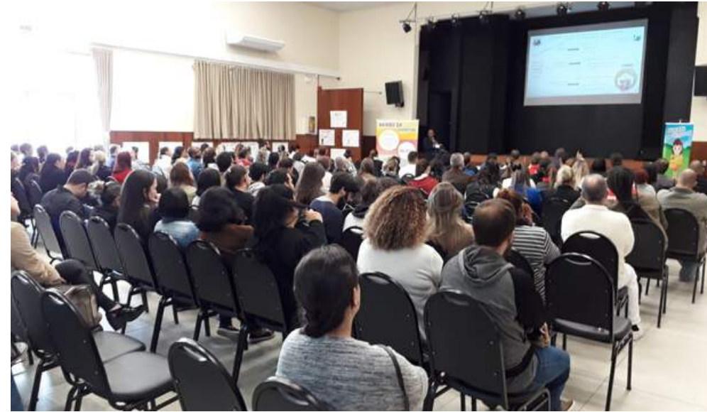
Capacitação para gestores