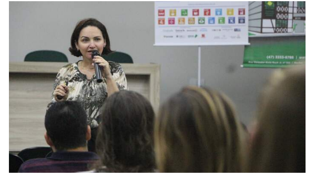
Seminário sobre Desenvolvimento Itajaí 03/2019