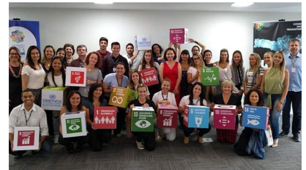
Café com Pauta Florianópolis 11/2019