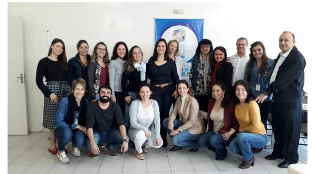
Capacitação para gestores