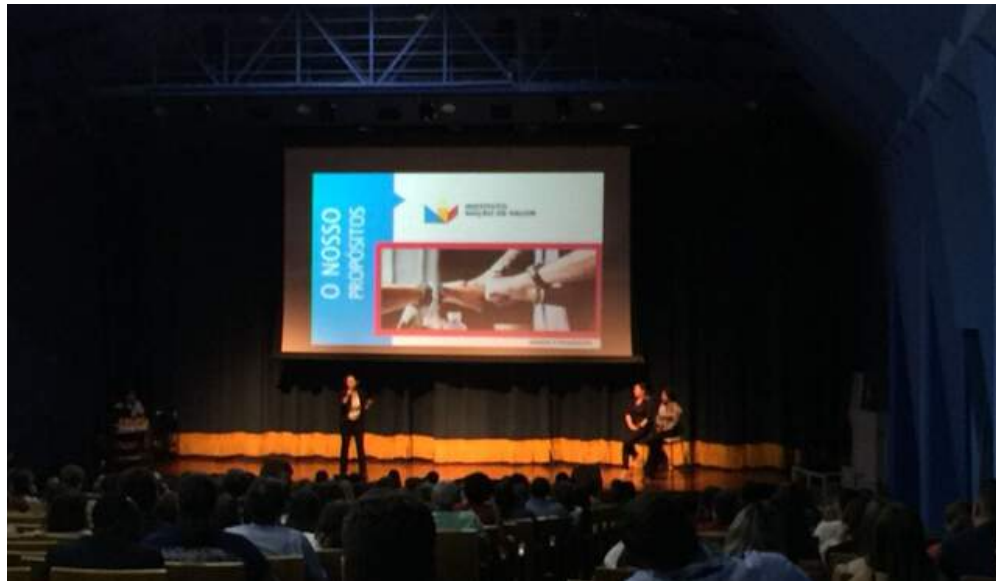
Congerhi São Paulo 08/2018