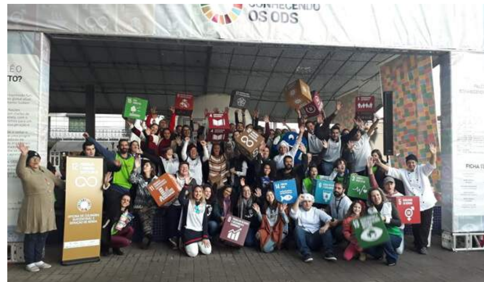
Caminhão Conhecendo os ODS Joinvile 08/2019