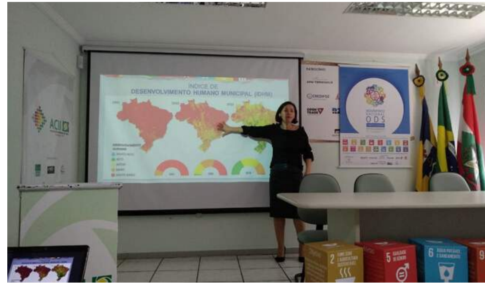
Seminário sobre Desenvolvimento Indaial 11/2018