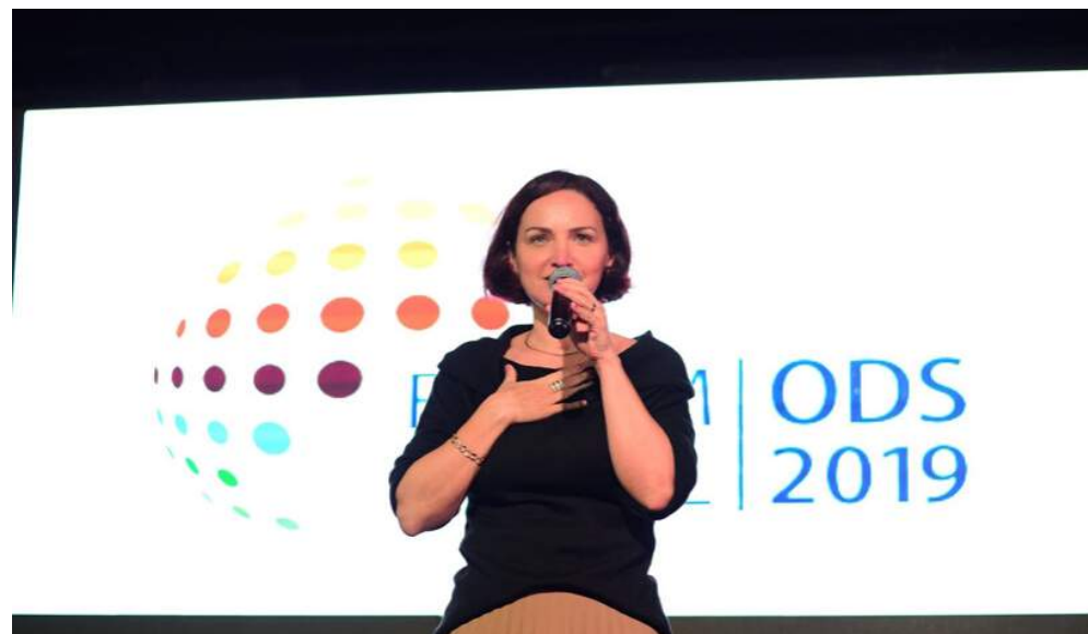
Fórum Brasil ODS Florianópolis 06/2019