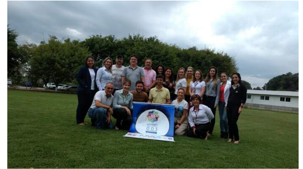
Capacitação para multiplicadores