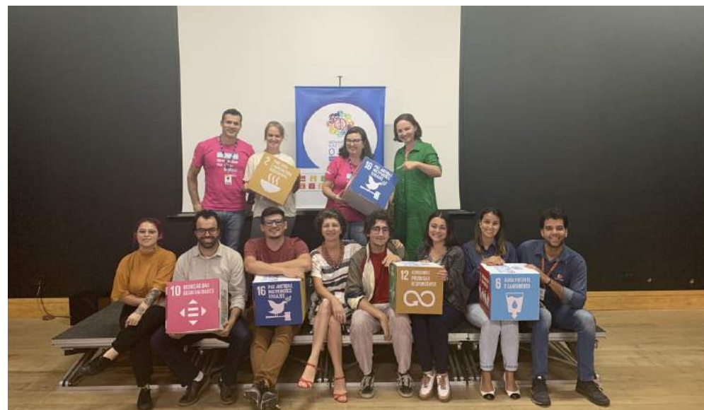
Capacitação para multiplicadores