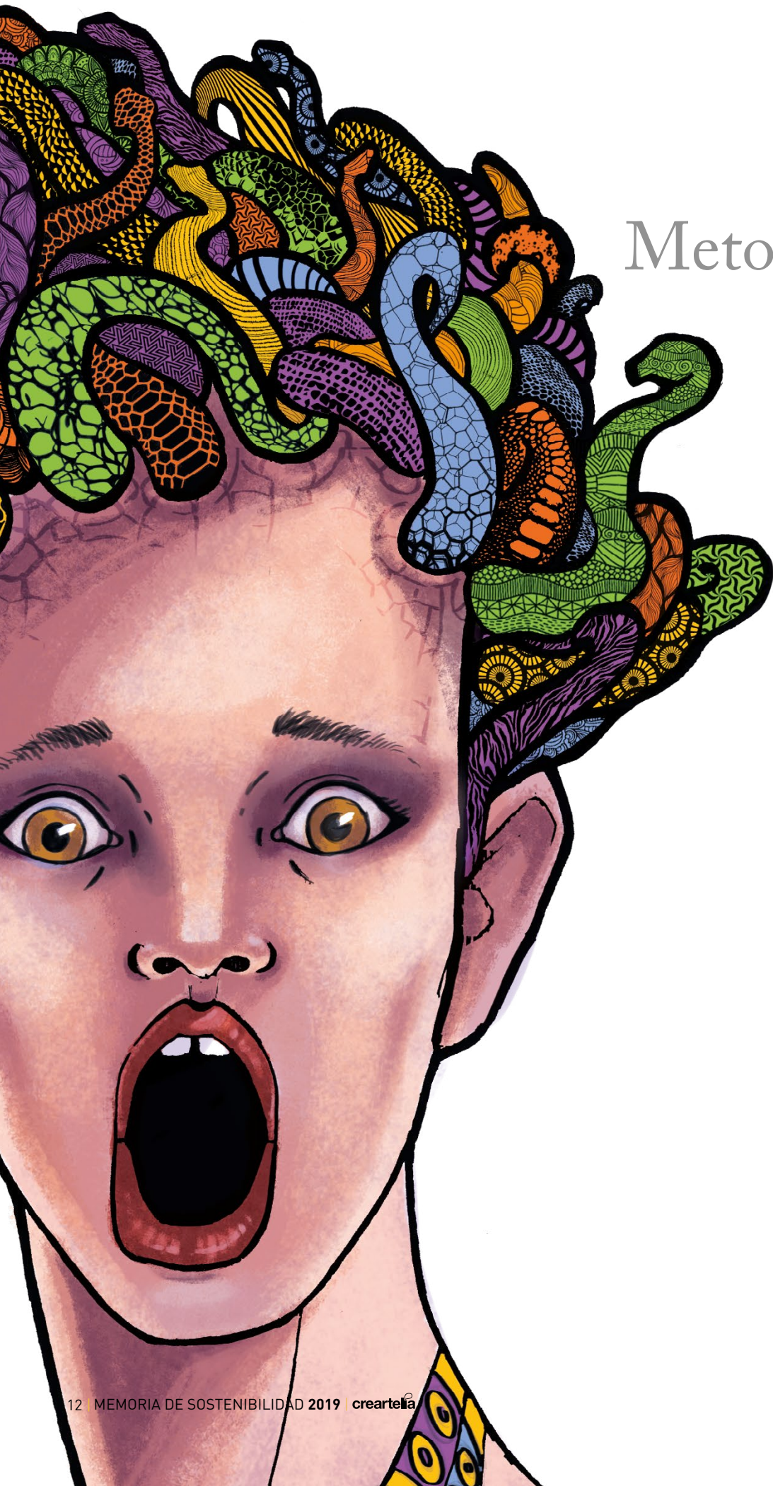
ILUSTRACIÓN POR CREARTELIA