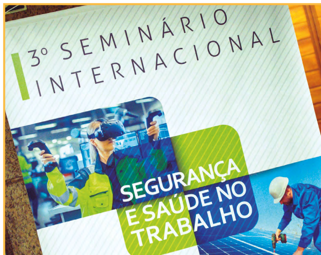
O 3º Seminário Internacional de Segurança e Saúde no Trabalho celebrou o centenário da Organização Internacional do Trabalho

O Programa Trabalho Seguro Regional foi instituído pelo Tribunal Superior do Trabalho e pelo Conselho Superior da Justiça do Trabalho visando à formulação e execução de projetos e ações nacionais voltados à prevenção de acidentes de trabalho e doenças, bem como ao fortalecimento de uma Política Nacional de Segurança e Saúde no Trabalho.