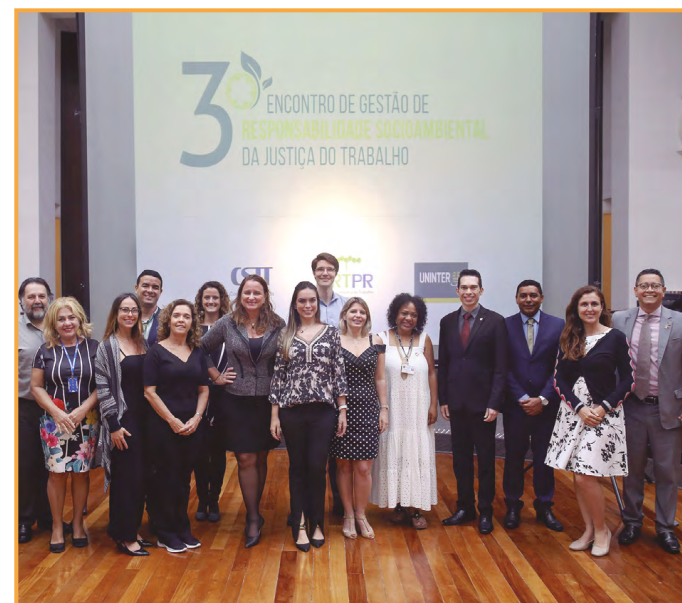
Gestores de todos os Regionais discutiram ações de sustentabilidade e alinharam estratégias para o Judiciário Trabalhista.

Todas as atividades programadas para o encontro tiveram intérpretes de LIBRAS (Língua Brasileira de Sinais), garantindo o acesso de pessoas com deficiência auditiva a todos os conteúdos debatidos durante o evento.