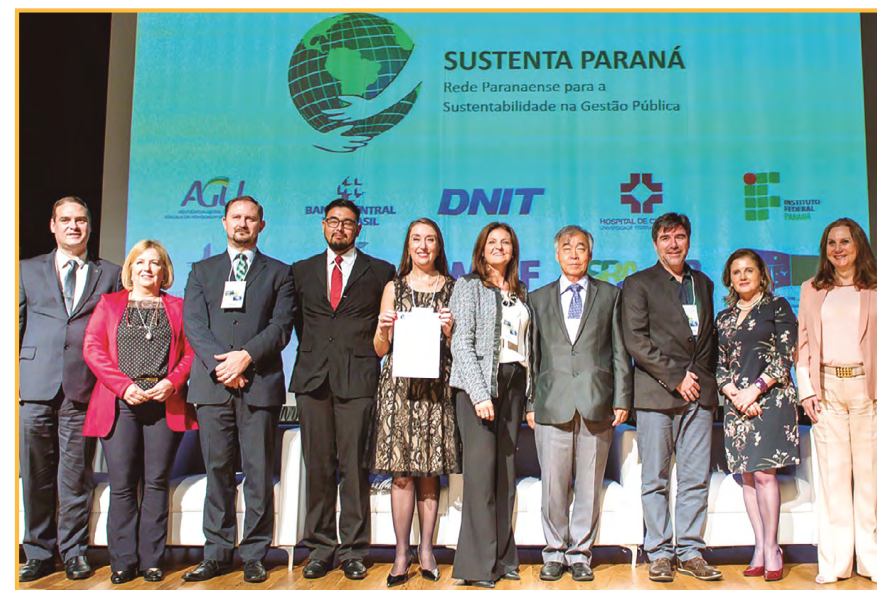
Instituições públicas que já atuavam integradas, formalizaram a Rede Sustenta Paraná durante o 3º Seminário Internacional de saúde e Segurança no Trabalho

Objetivos de Desenvolvimento Sustentável 16