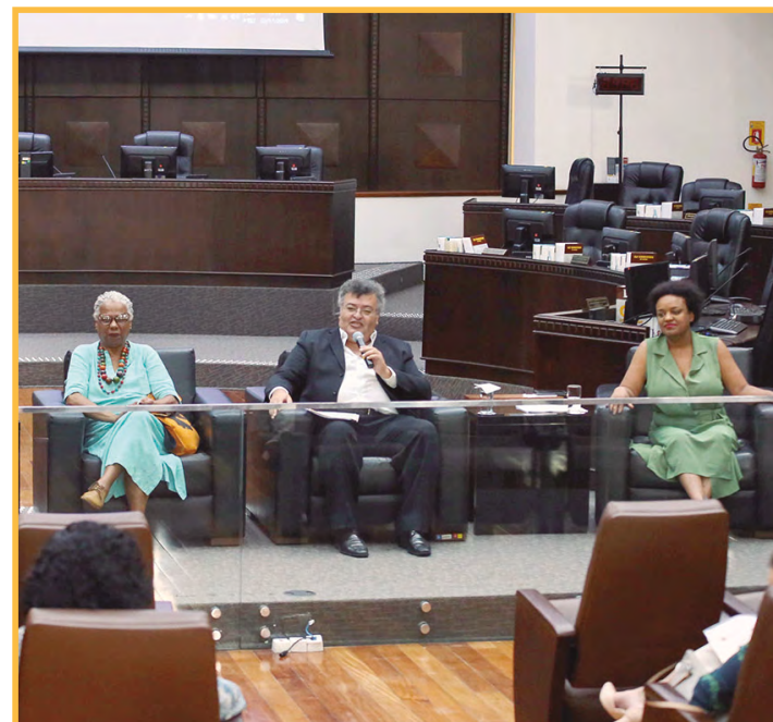
Cuidado com os atuais e futuros cidadãos se revela também nas salas de amamentação e fraldários dos Fóruns Trabalhistas do TRT do Paraná

Foram ações de sensibilização por meio da geração de conhecimento, destinados ao público interno e externo, e com apoio de signatários do Pacto Global, como Tribunal de Justiça do Paraná.