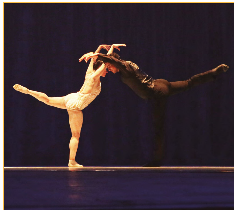
O Lago dos Cisnes, dançado pelo Balé do Teatro Guaíra

Objetivos de Desenvolvimento Sustentável 10 16 17