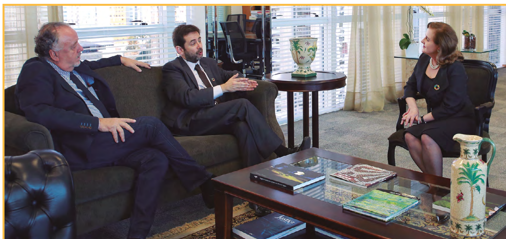
Representantes do Pacto Global da ONU foram recebidos na Presidência do TRT-PR em maio de 2018.

Objetivos de Desenvolvimento Sustentável 16