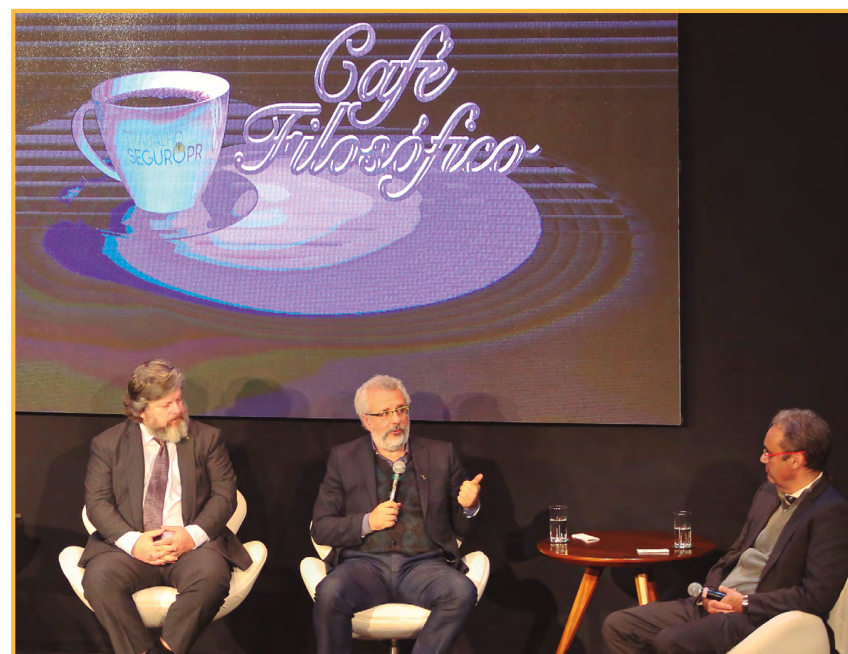
Discussões sobre sustentabilidade no trabalho fizeram parte de eventos do TRT do Paraná

Objetivos de Desenvolvimento Sustentável 5 8