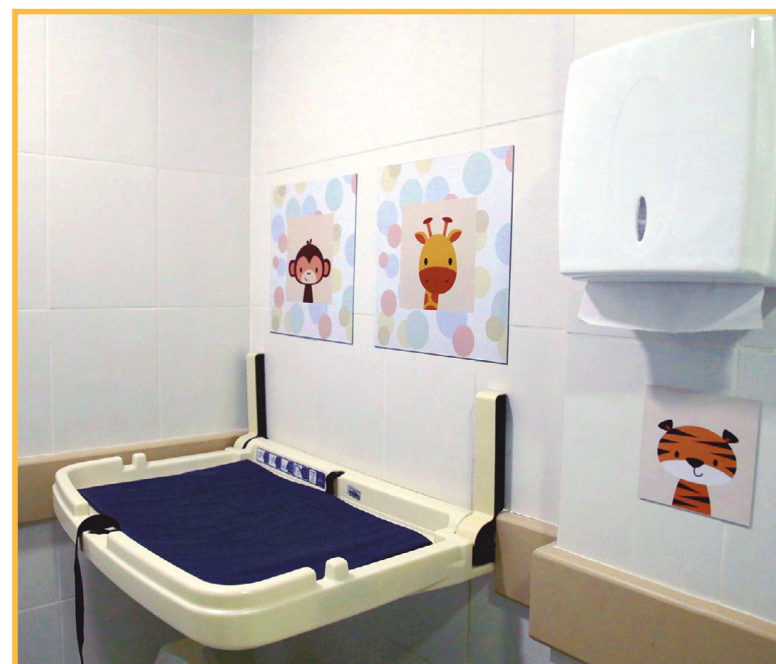
Cuidado com os atuais e futuros cidadãos se revela também nas salas de amamentação e fraldários dos Fóruns Trabalhistas do TRT do Paraná

Com estas estruturas, as mães lactantes que frequentam os Fóruns - advogadas e jurisdicionadas, em grande parte – possuem espaços adequados para alimentação de seus filhos. Para a higiene de crianças que acompanham mães e pais em audiências na Justiça do Trabalho, os fraldários inaugurados são ambientes preparados para o correto asseio infantil fora do espaço de banheiros femininos.